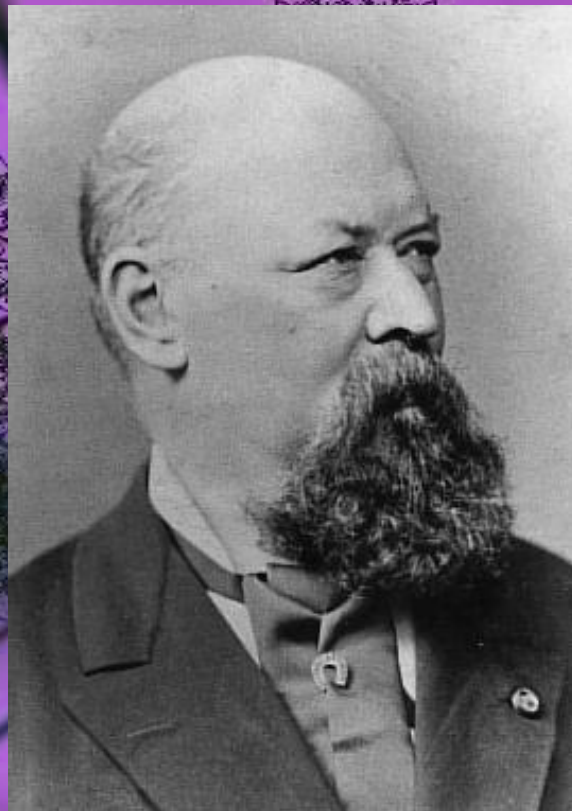
Франц фон Суппе (1819 —1895 г.г.)