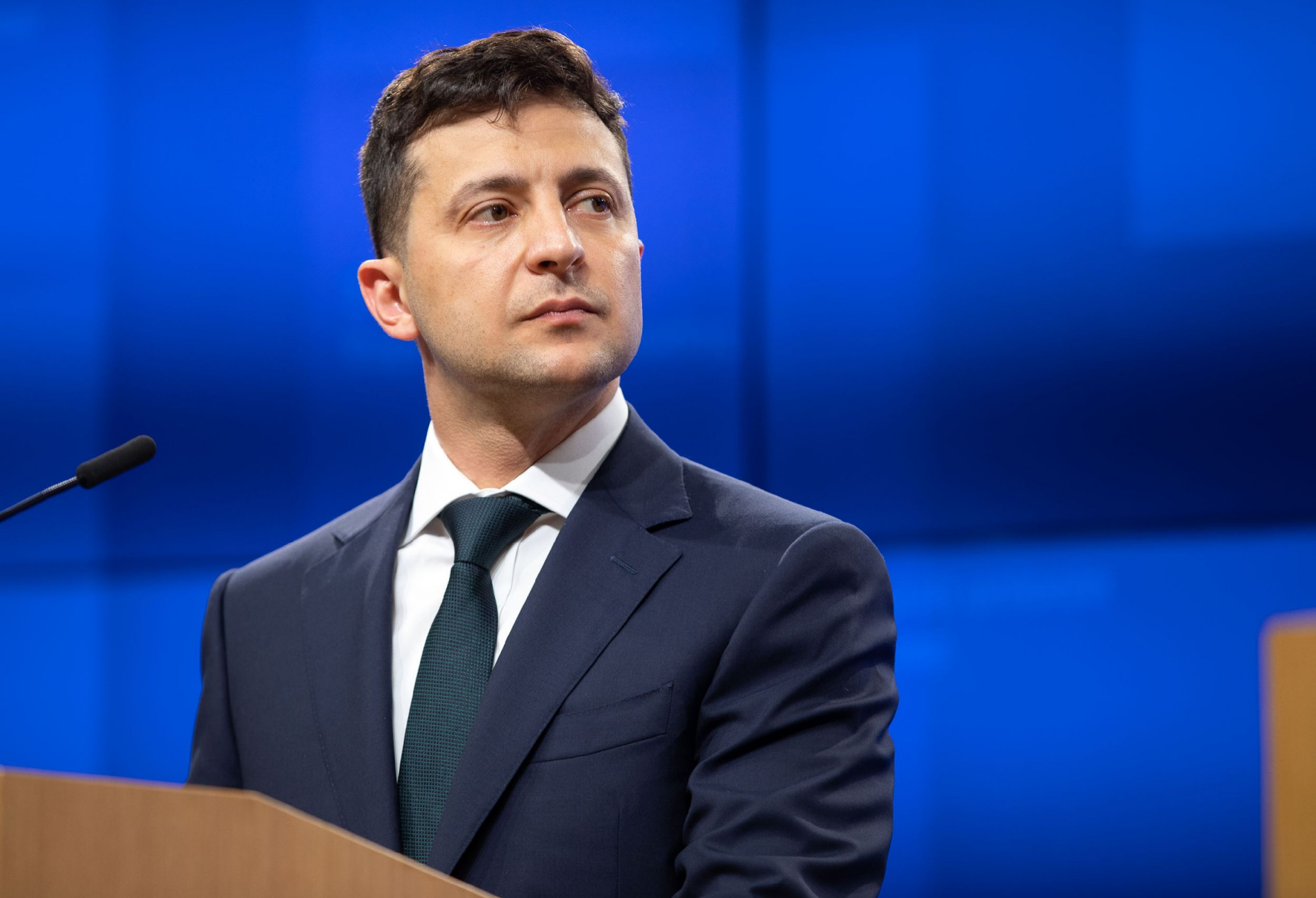
Президент Украины: Владимир Александрович Зеленский (с 20 мая 2019г)