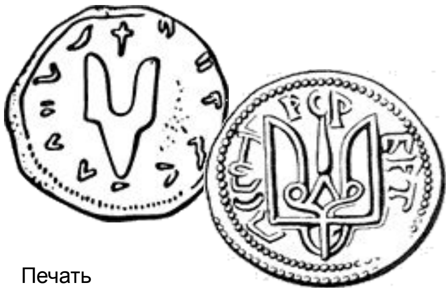
Печать Святослава Игоревича. Киев, до 972 г.