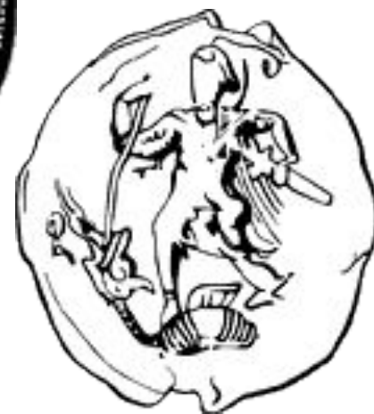
Печать XII века с Архангелом Михаилом.