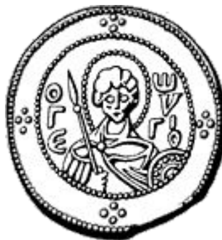
Св. Георгий на сребренике Ярослава Мудрого.