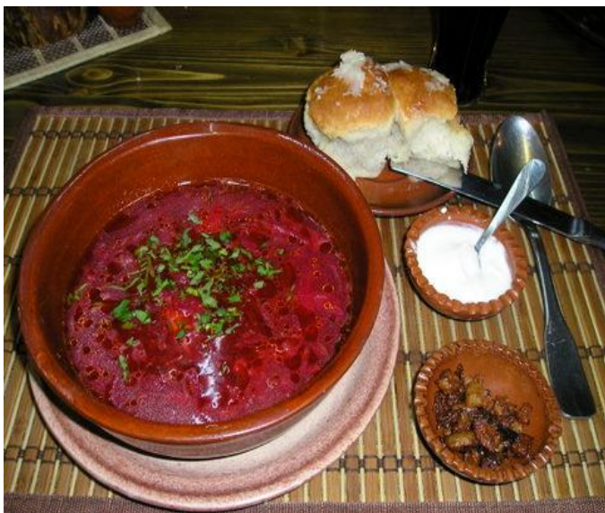
Борщ с пампушками.

Украинская кúхня складывалась на протяжении многих веков. На всей территории современной Украины она остаётся достаточно однородной как по применяемому набору продуктов, так и по способам их переработки. Некоторые её блюда получили широкое распространение среди других народов, особенно славянских, как восточных, так и западных.