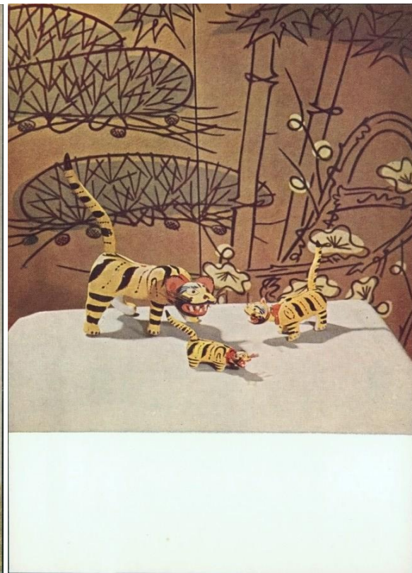
Прикладное искусство Японии. Народные игрушки. Тигры.