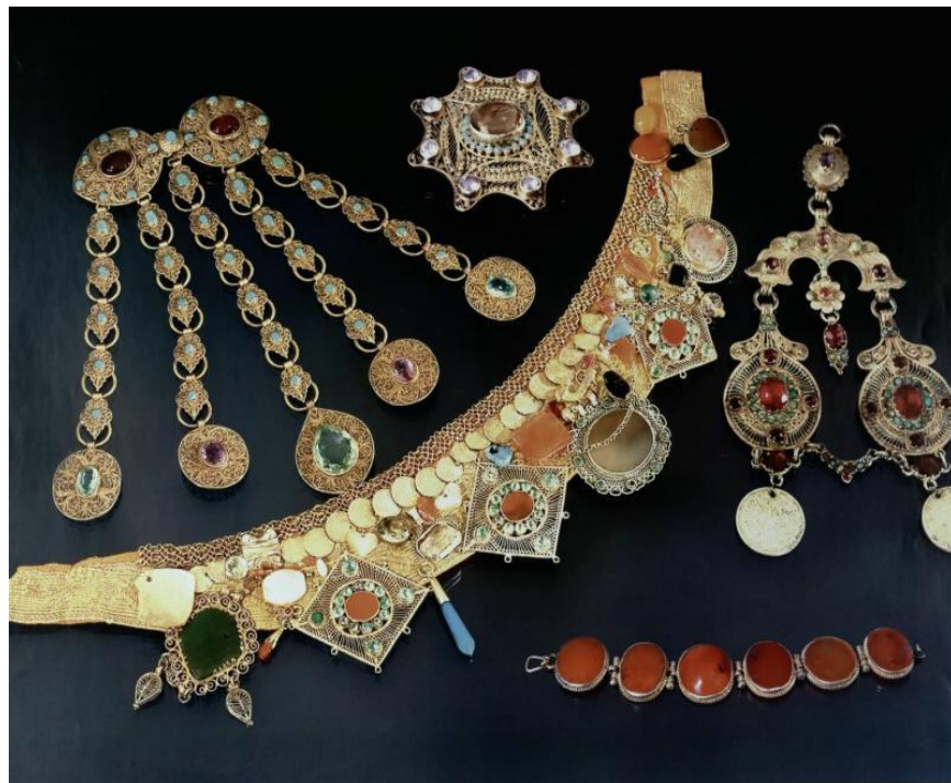
Наглядное пособие. Ювелирное дело. Из комплекта "Культурное наследие в воспитании подрастающего поколения "Из века в век"

Ювелир изготавливает изящные, миниатюрные, искусно обработанные украшения и изделия прикладного искусства с добавлением драгоценных металлов и камней.