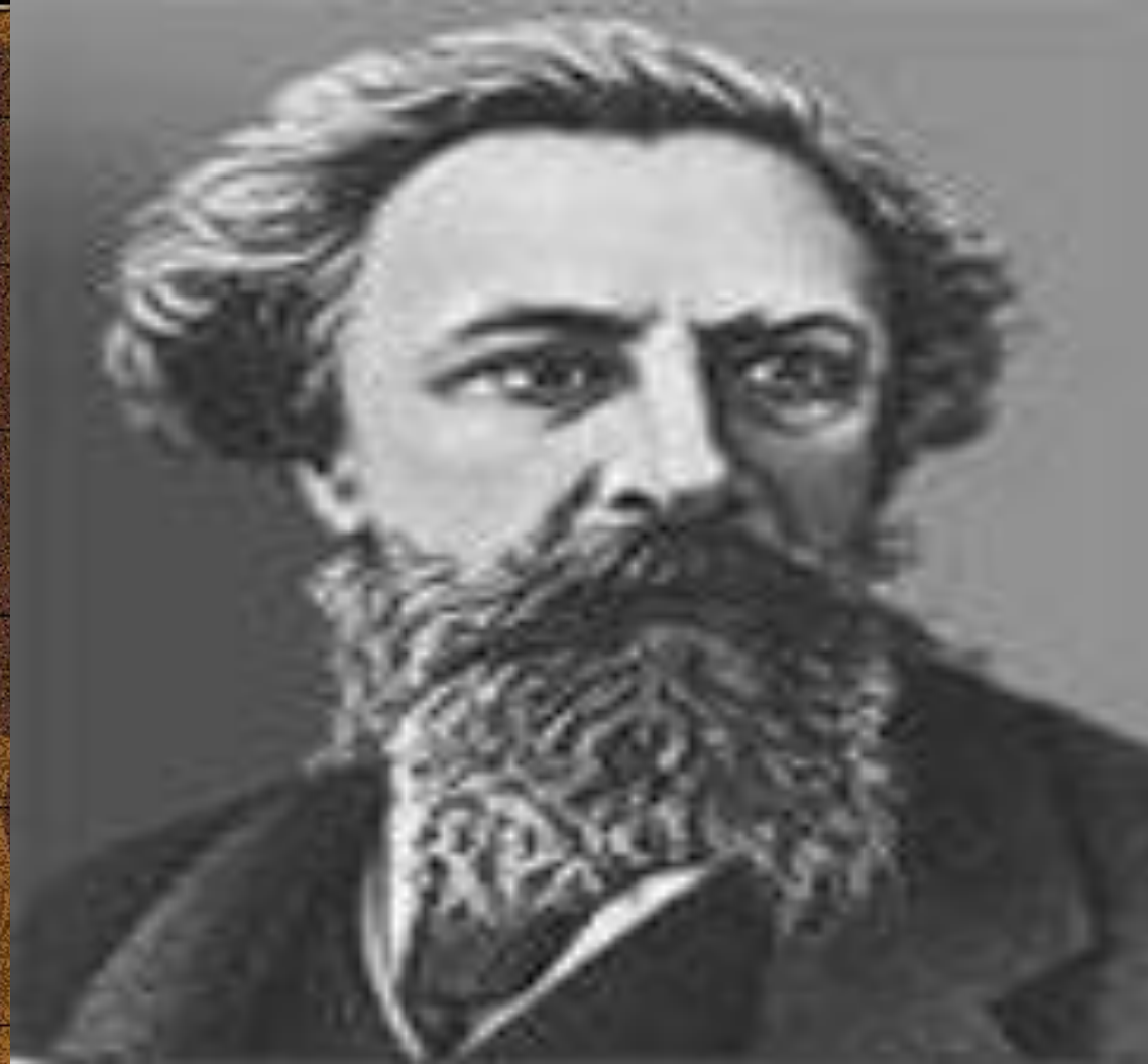
Алексей Константинович Толстой