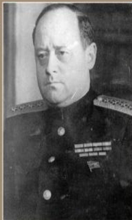
Иван Степанович Исаков (Ованес Исаакян)

После войны адмирал флота И.С.Исаков был начальником Главного штаба, заместителем главнокомандующего ВМФ СССР, заместителем министра Морского флота СССР.