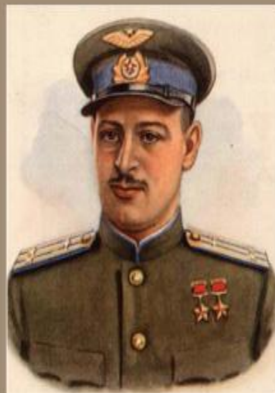
Нельсон Георгиевич Степанян лётчик-штурмовик, гвардии подполковник, дважды Герой Советского Союза

28.3.1913, Шуши, Нагорный Карабах - 14.12.1944, Лиепая, Латвия