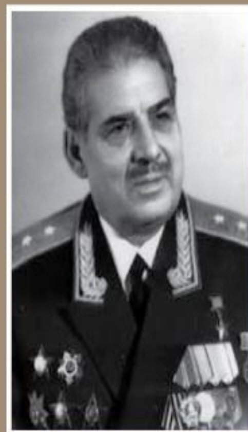
Александр Сидорович Мнацаканов Генерал-лейтенант, Герой Советского Союза

В 2010 г. в Гатчине поставлен памятник Мнацаканову от армянской общины Санкт-Петербурга.