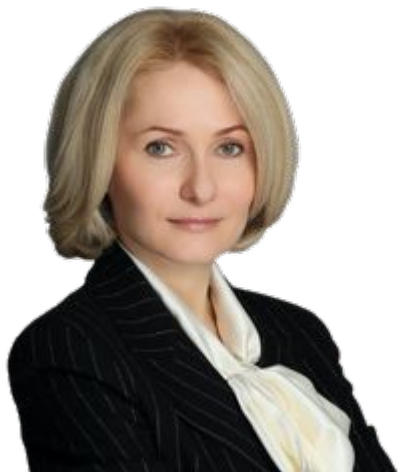
Виктория Валериевна Абрамченко

Заместитель Председателя Правительства Российской Федерации