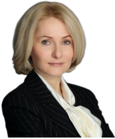
Виктория Валериевна Абрамченко

Заместитель Председателя Правительства Российской Федерации