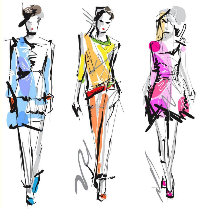
Работа с цветом в моде

Углубленные теоретические знания, а также практические навыки работы с цветом и цветовыми сочетаниями пригодятся в любой области, связанной с творчеством. К примеру флористика, изобразительное искусство, мода и дизайн во всех его проявлениях.