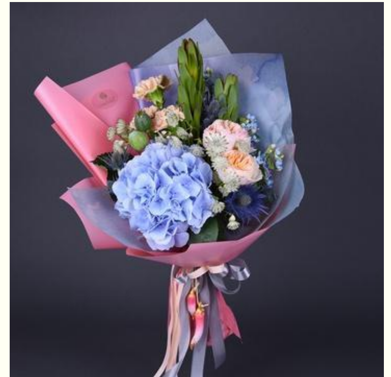
Работа с цветом во флористике