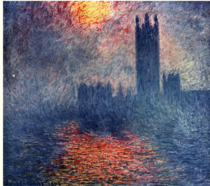
Клод Моне "Лондонский парламент в тумане"