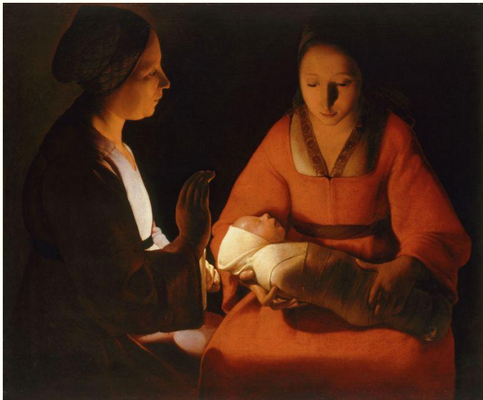
Жорж де ла Тура "Новорожденный"

Классическая строгая терминология поясняется вольным повествованием, основанным на собственном опыте автора, а так же на примерах деятелей искусства, создавших картины с определенными особенностями, о которых говорится в той или иной главе.