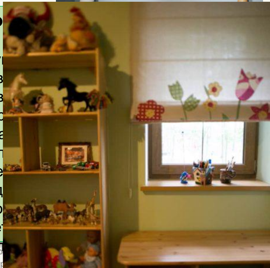
перебування у Климівці.