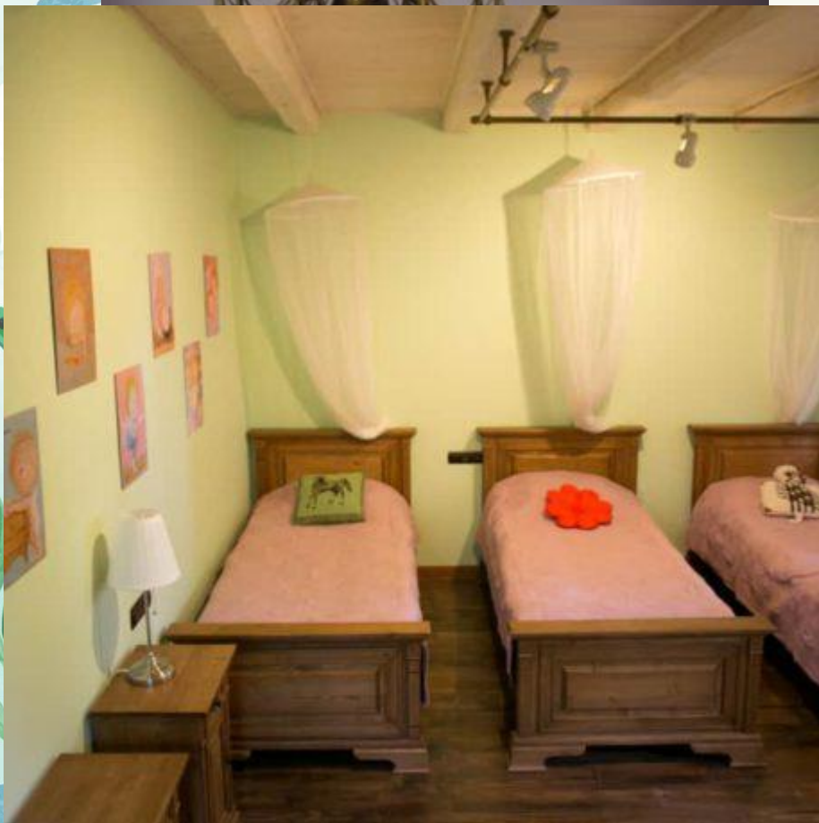
основному та гостьовому.

Якщо ви любите спокій та тишу, то вам буде комфортно в цій спальні.