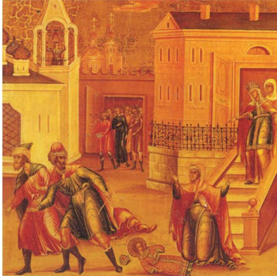
Убийство царевича Дмитрия в Угличе. Миниатюра XVII в.