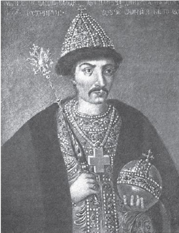
Царь Борис Фёдорович. Портрет XVII в.