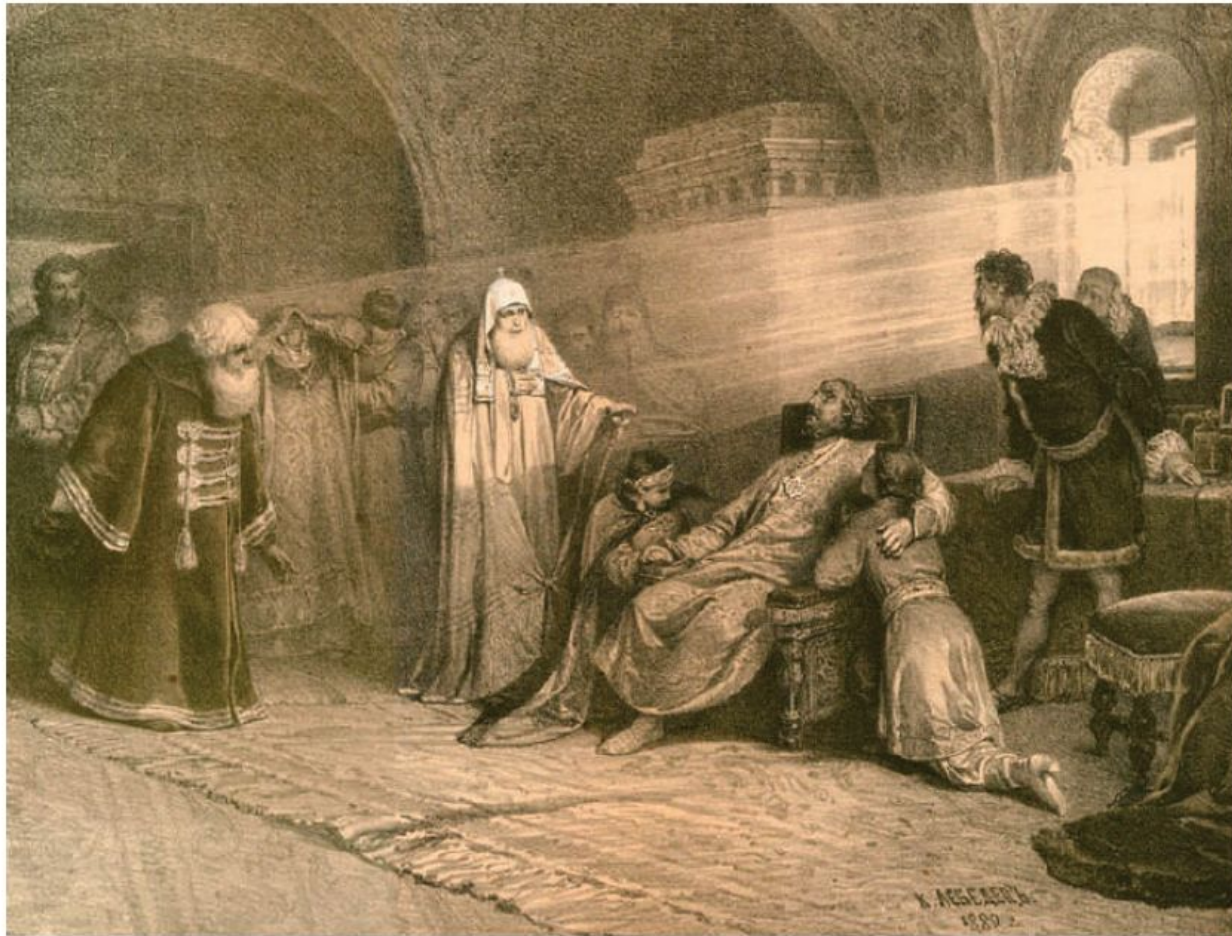
Смерть Бориса Годунова. Художник К.В. Лебедев