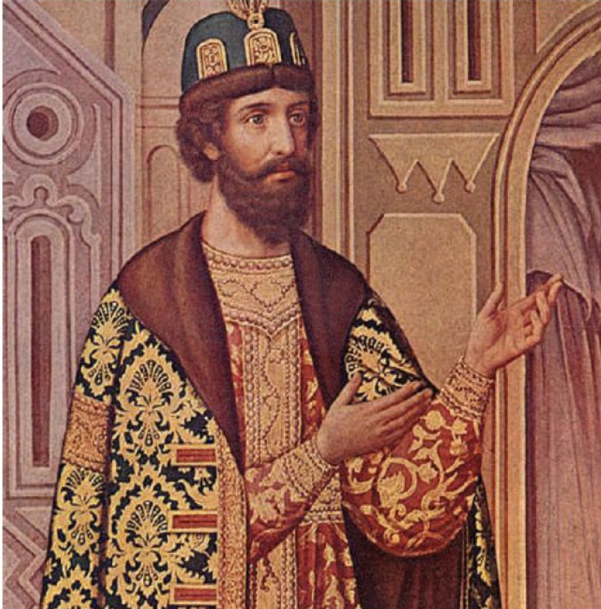
Боярин Борис Фёдорович Годунов. Роспись Грановитой палаты