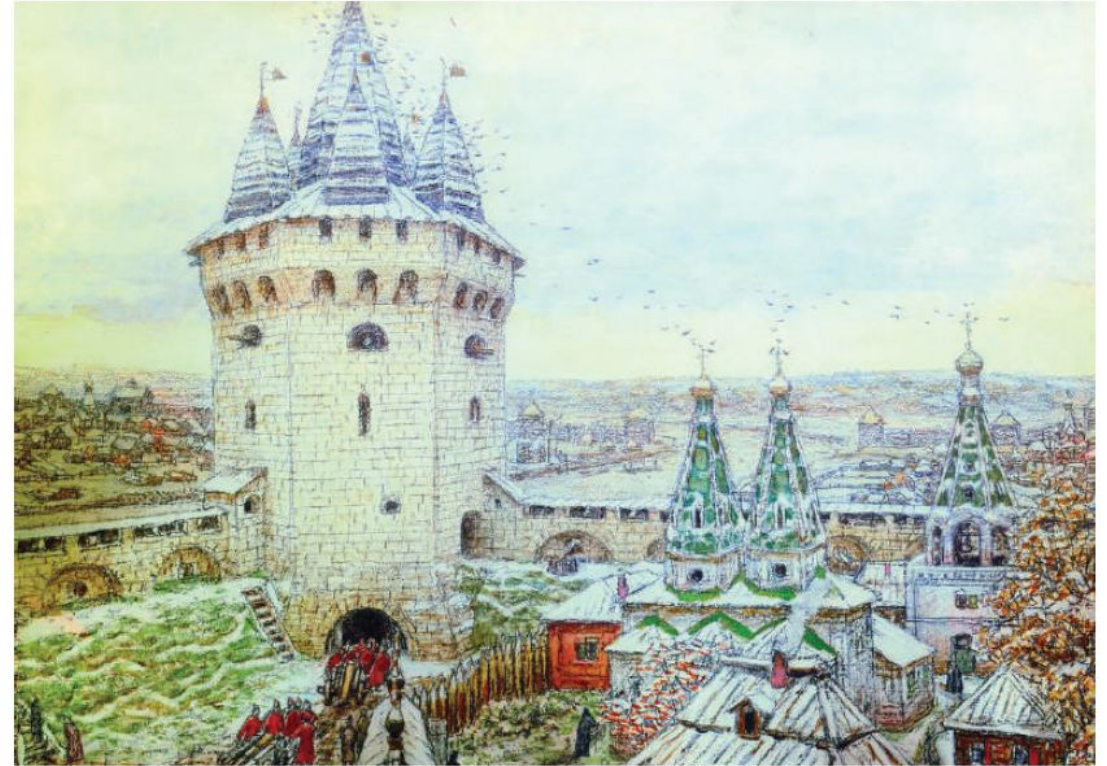
Семиверхая угловая башня Белого города. Художник А.М. Васнецов