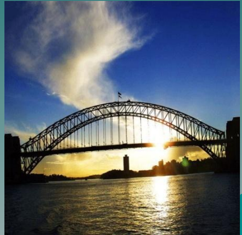
Гигантский одноарочный мост протяженностью 4 км.