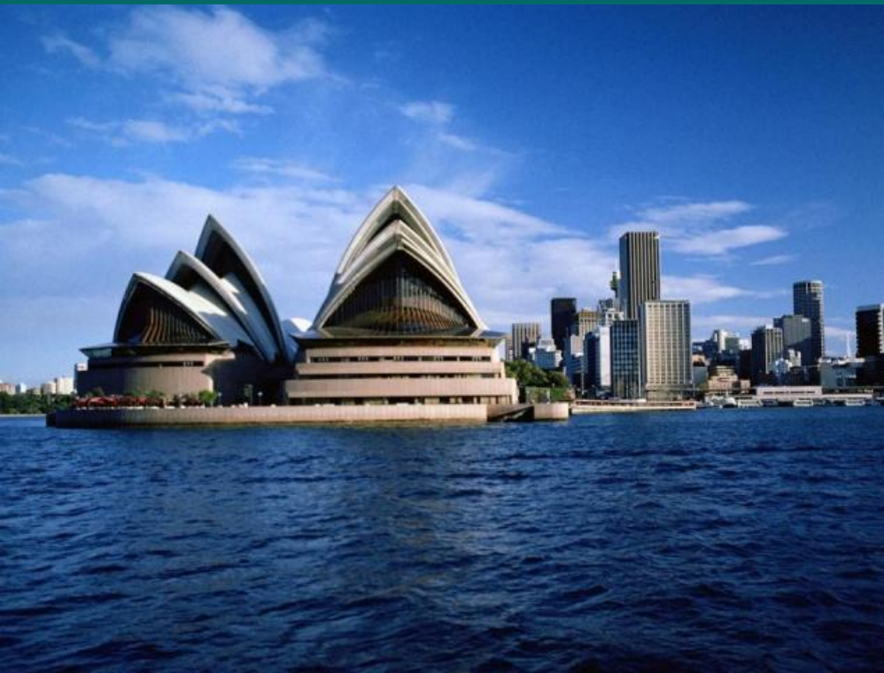
Здание оперного театра