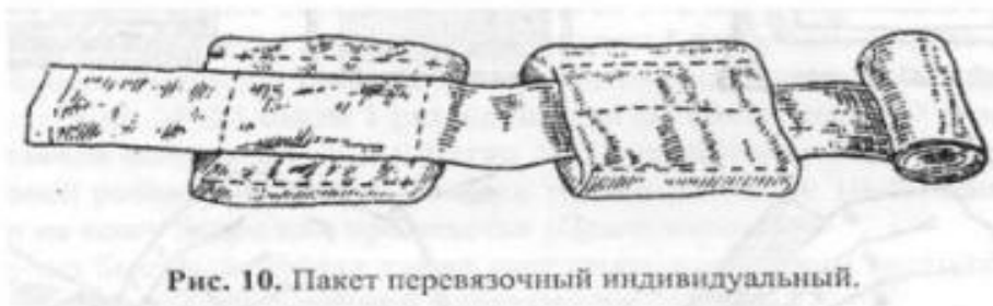
Рис. 10. Пакет перевязочный индивидуальный.

Пакет перевязочный индивидуальный (ППИ, ППМ) предназначен для наложения первичной асептической повязки на рану, ожоговую поверхность. Он содержит стерильный перевязочный материал, который заключен в две оболочки: наружную из прорезиненной ткани (с напечатанным на ней описанием способа вскрытия и употребления) и внутреннюю - из бумаги. Оболочки обеспечивают стерильность перевязочного материала, предохраняют его от механических повреждений, сырости и загрязнения. Материал, находящийся в пакете, состоит из марлевого бинта шириной 10 см и длиной 7 м и двух равных по величине ватно-марлевых подушечек размером 17х32 см. Одна из подушечек пришита к бинту, другая связана с ним подвижно и может свободно передвигаться по длине бинта.