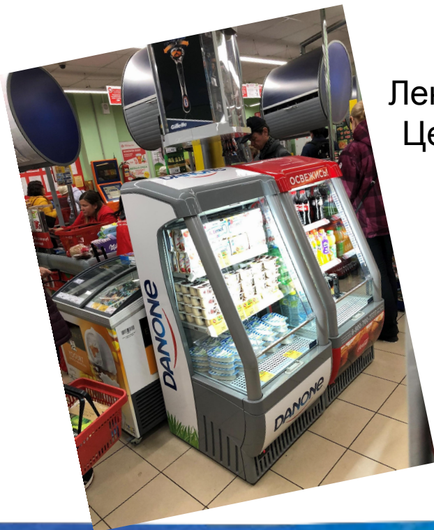
Ленинградская 35 Центральная 15