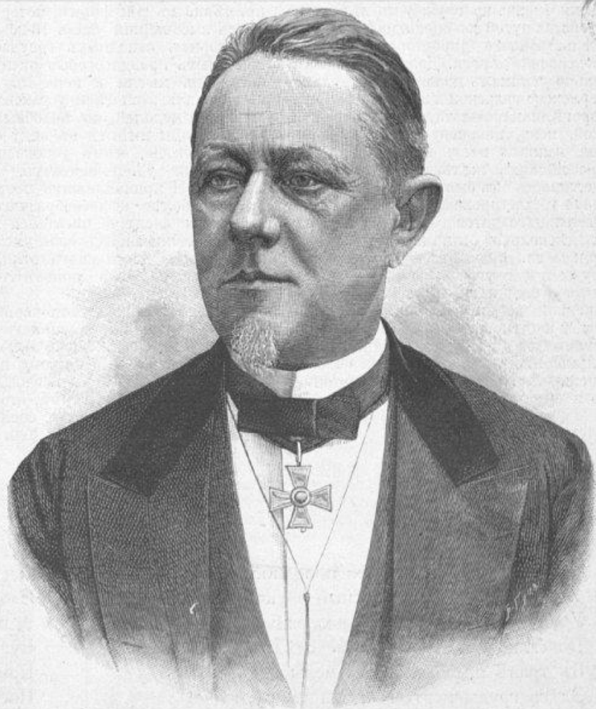
Князь М. И. ХИЛКОВЪ, новый управляющій министерствомъ путей сообщенія.