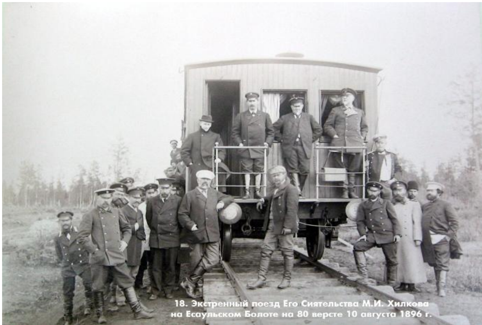
18. Экстренный поезд Его Сиятельства М.И. Хилкова на Есаульском Болоте на 80 версте 10 августа 1896 г.