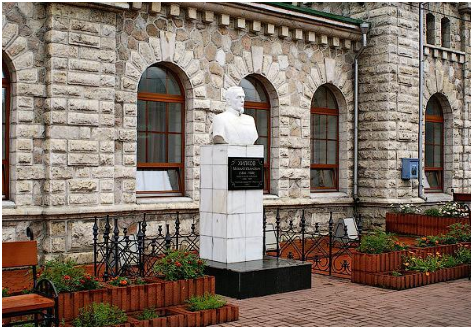
Памятник М.И. Хилкову в Слюдянке