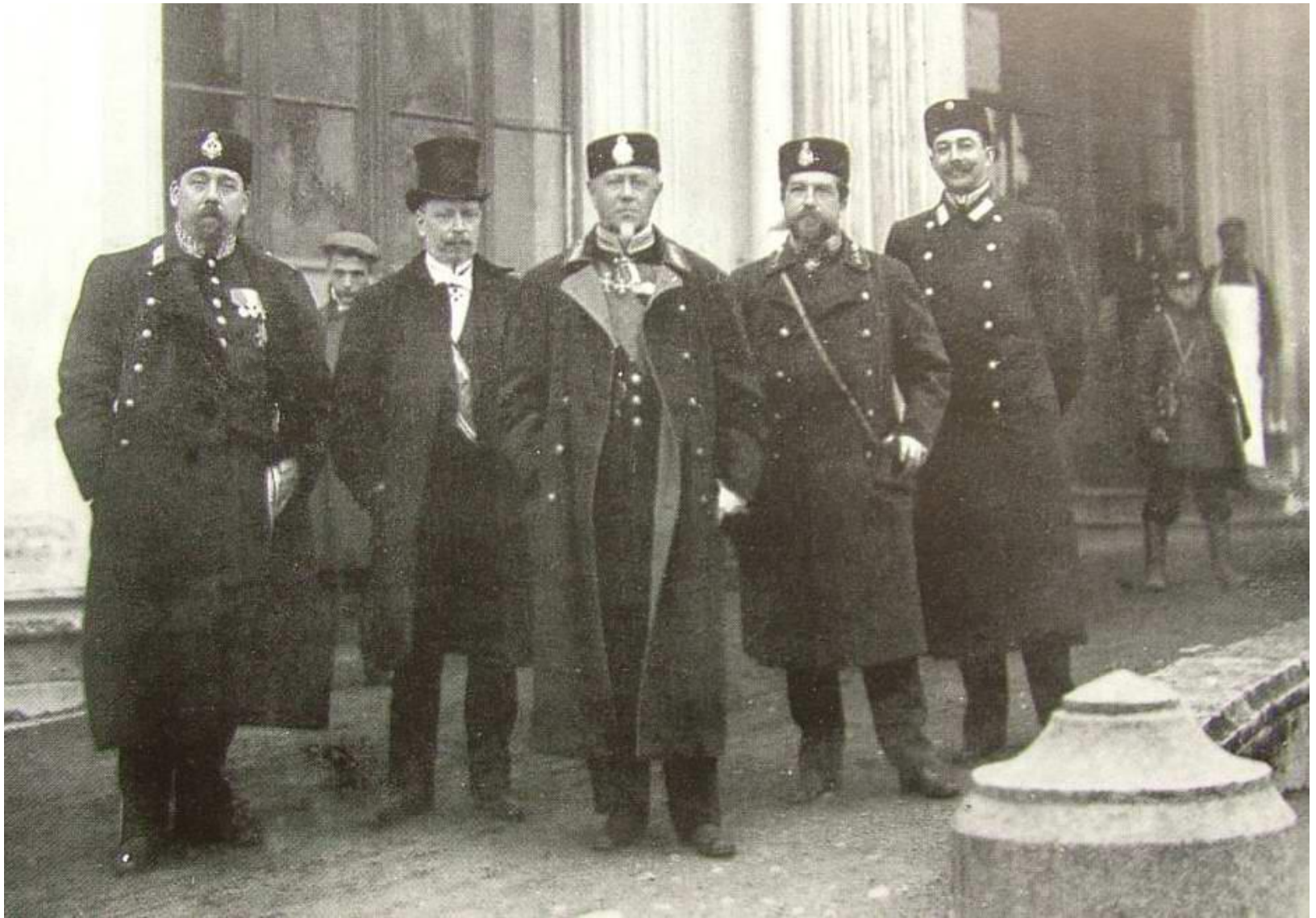
Железнодорожники XIX век