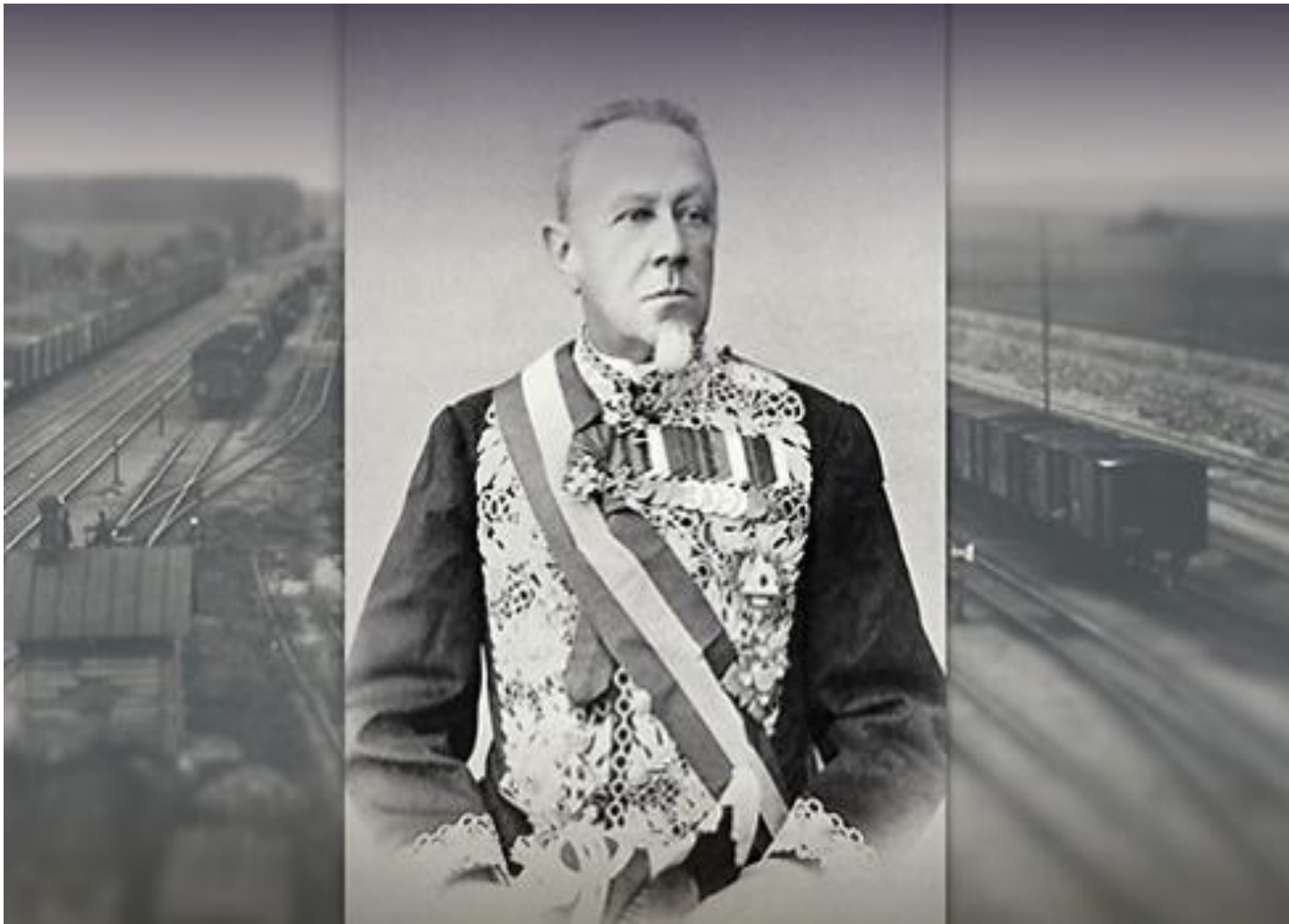
Портрет Хилкова М. И.