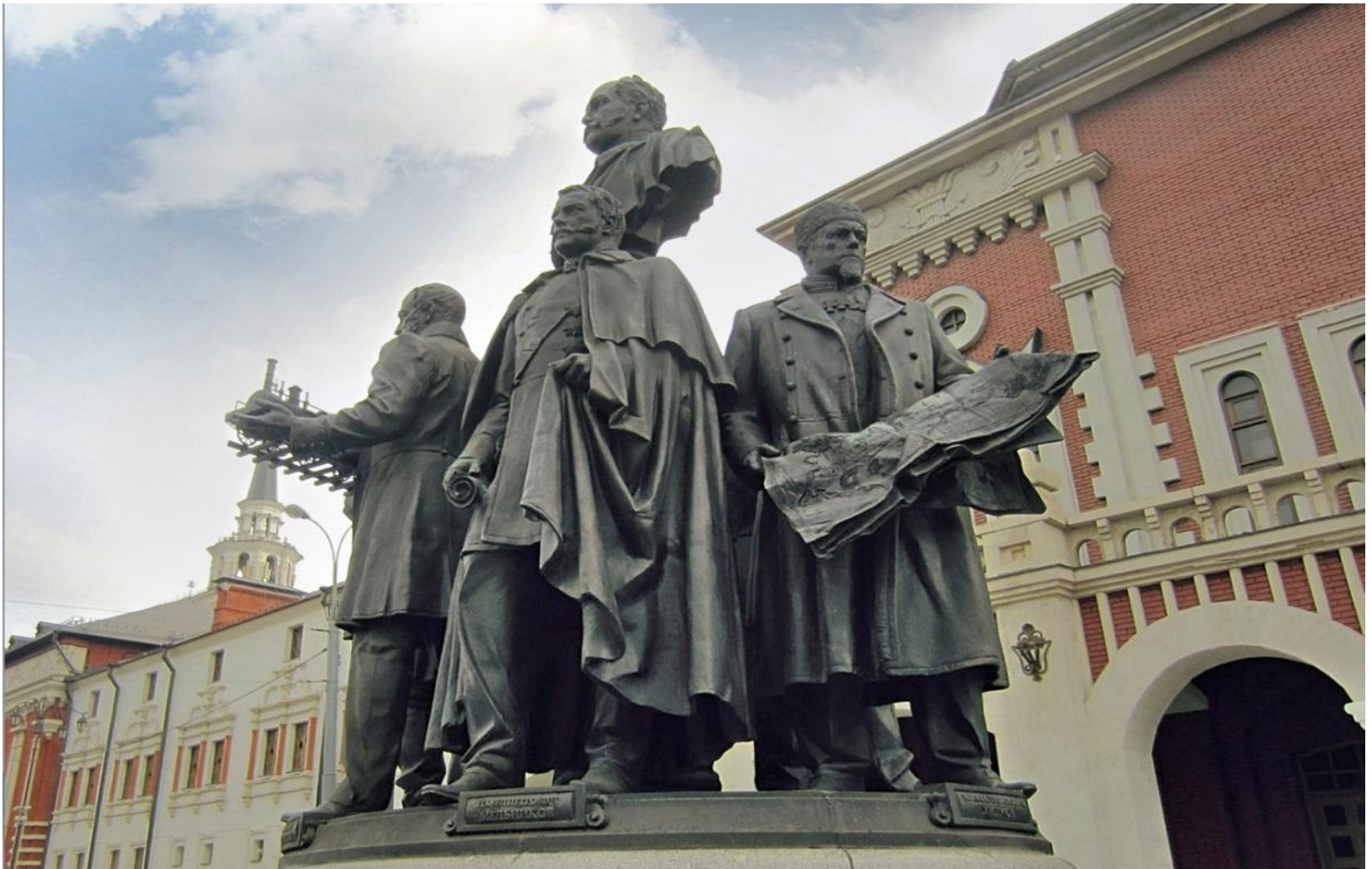
Памятник «Создателям российских железных дорог» в Москве