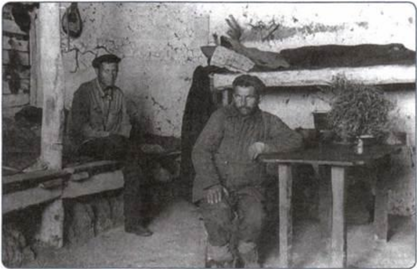
В землянке «спецконтингента» на строительстве железной дороги. 1940-е гг.