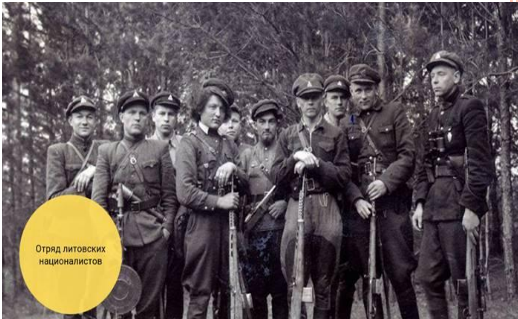
Отряд литовских националистов