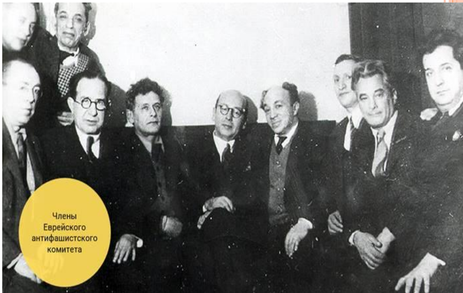
Члены Еврейского антифашистского комитета