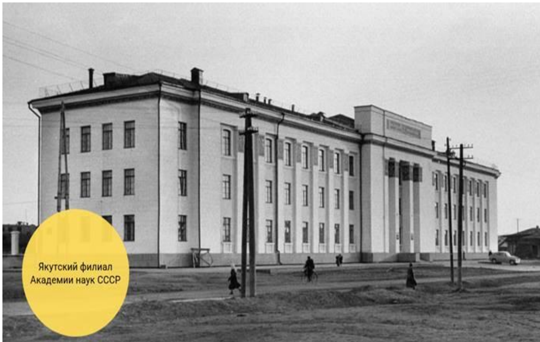
Якутский филиал Академии наук СССР