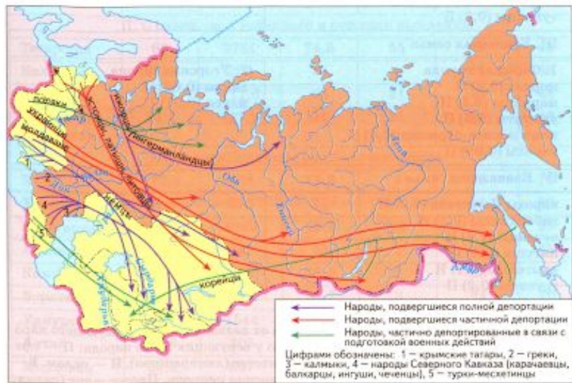
Рис. 10. Депортация народов в СССР