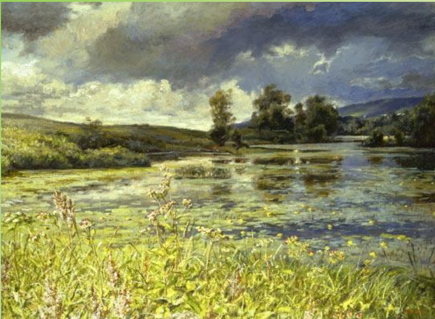
с. Прислониха – родина художника в Ульяновской области