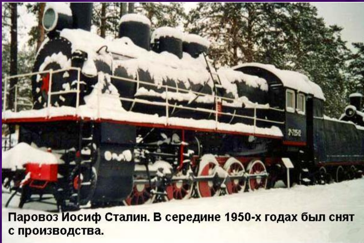
Паровоз Иосиф Сталин. В середине 1950-х годах был снят с производства.

Кочегар в такой паровоз бросал в топку уголь. Пламя и газы испаряли воду в котле и нагревали пар. Пар поступал в паровые машины, вращавшие огромные колёса.