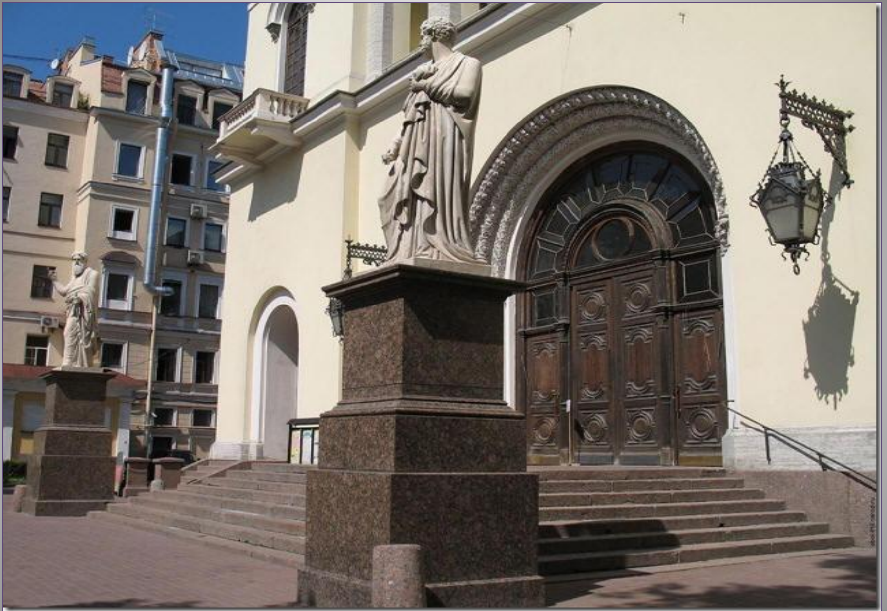
There are two sculptures of St. Apostles Peter and Paul