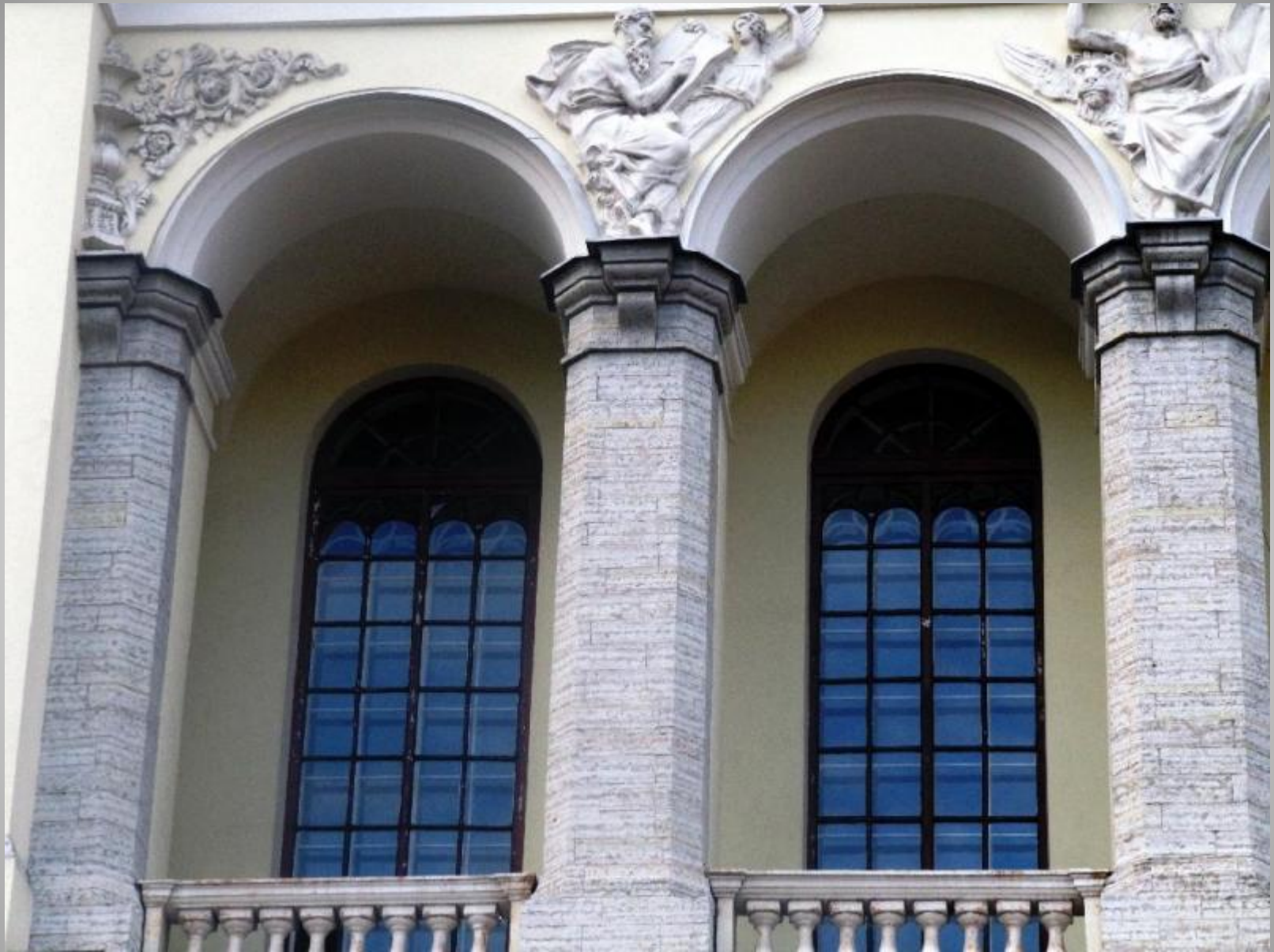
There is an open arcade loggia on the second floor.