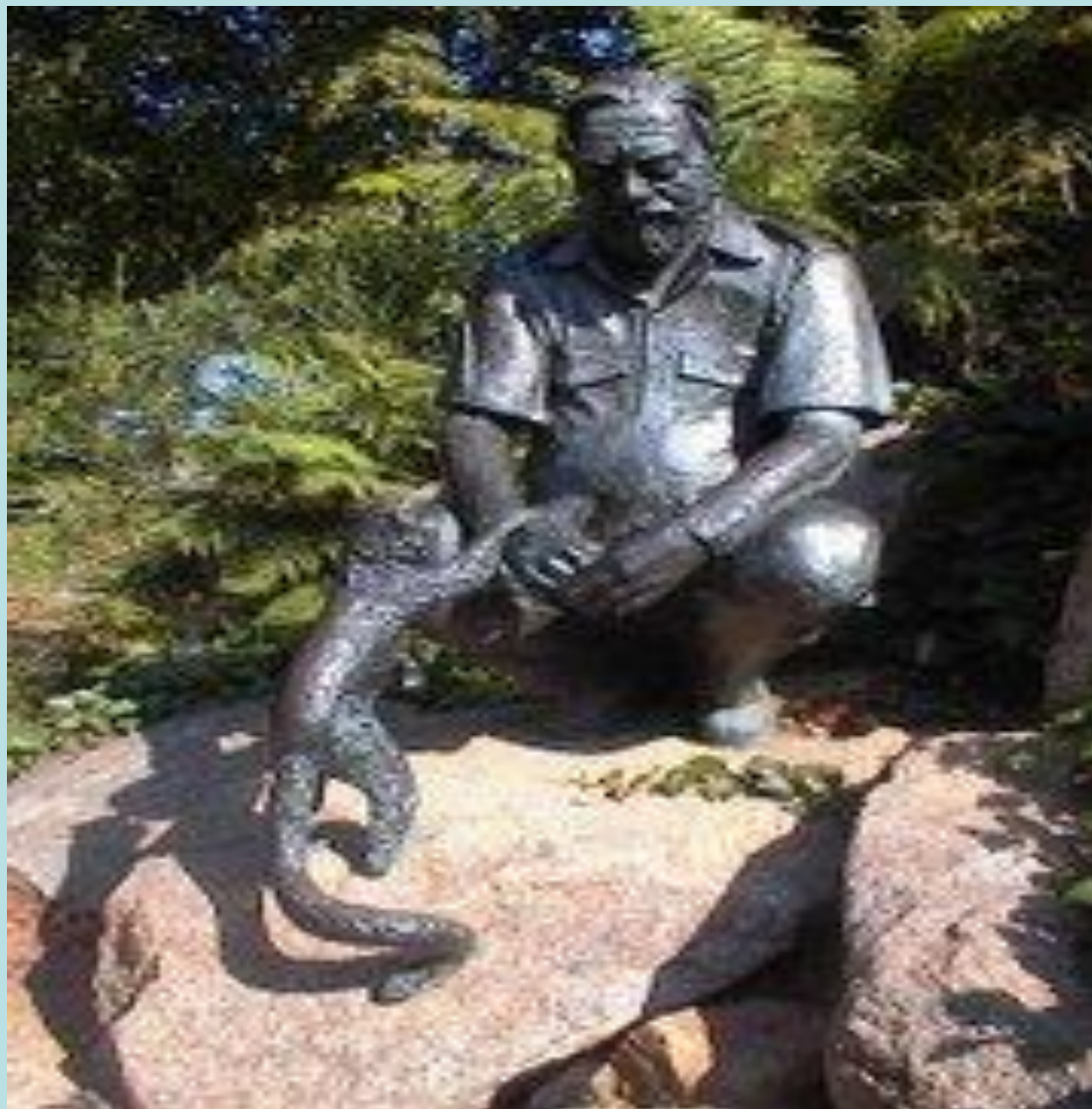
Скульптура в зоопарке Джерси