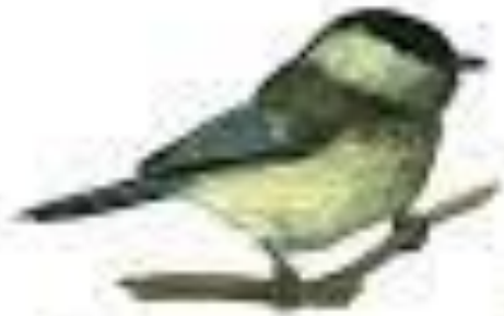
Синица гаичка Синица гаичка