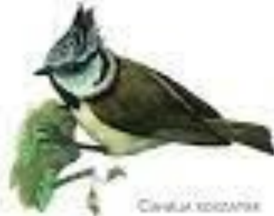
Синица хохлатая Синица хохлатая