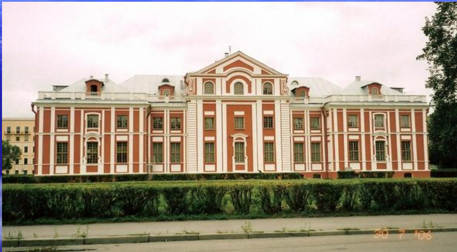
Кикины палаты, арх. неизвестен