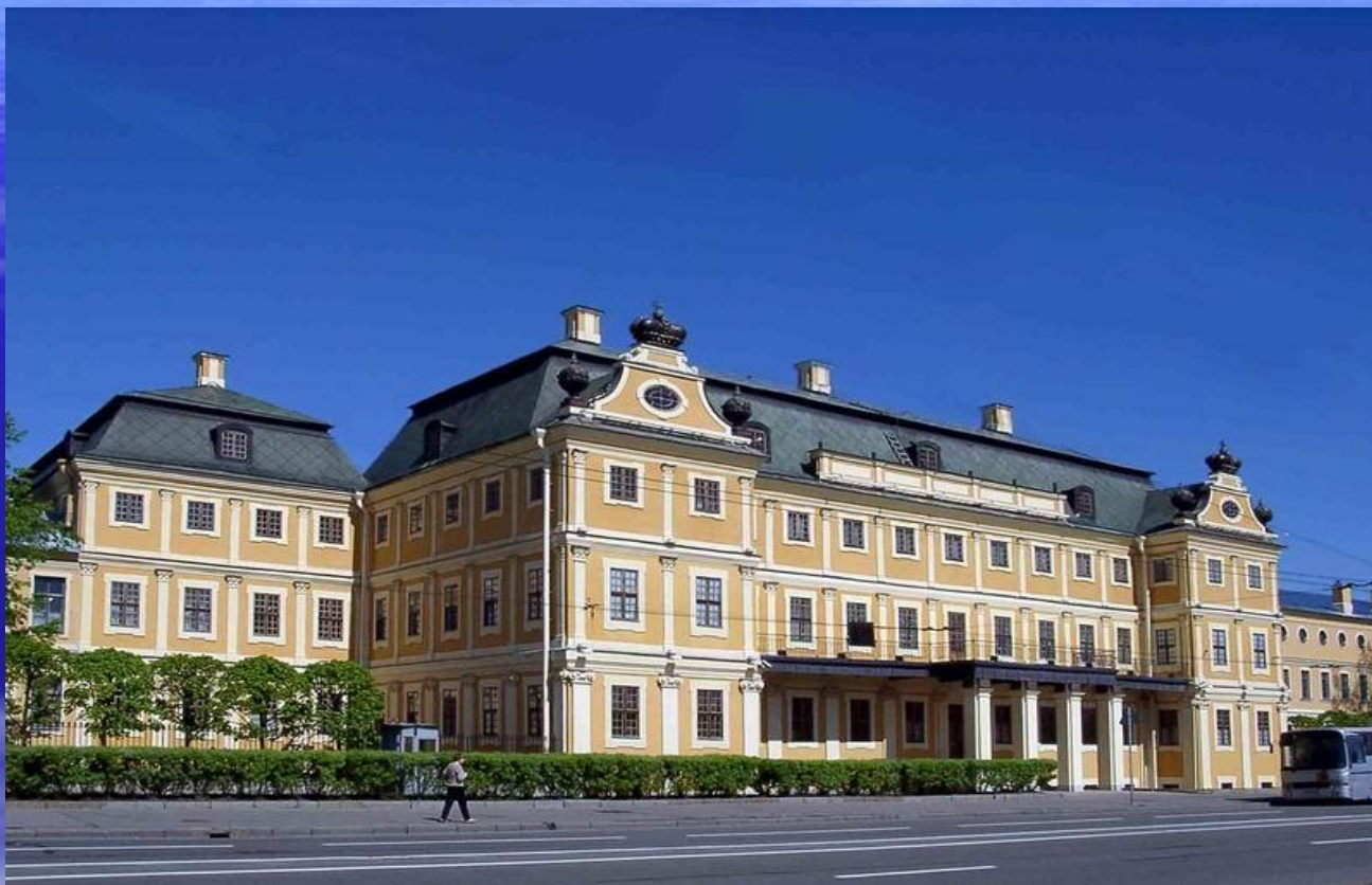
Меншиковский дворец, арх. Фонтана, Шедель