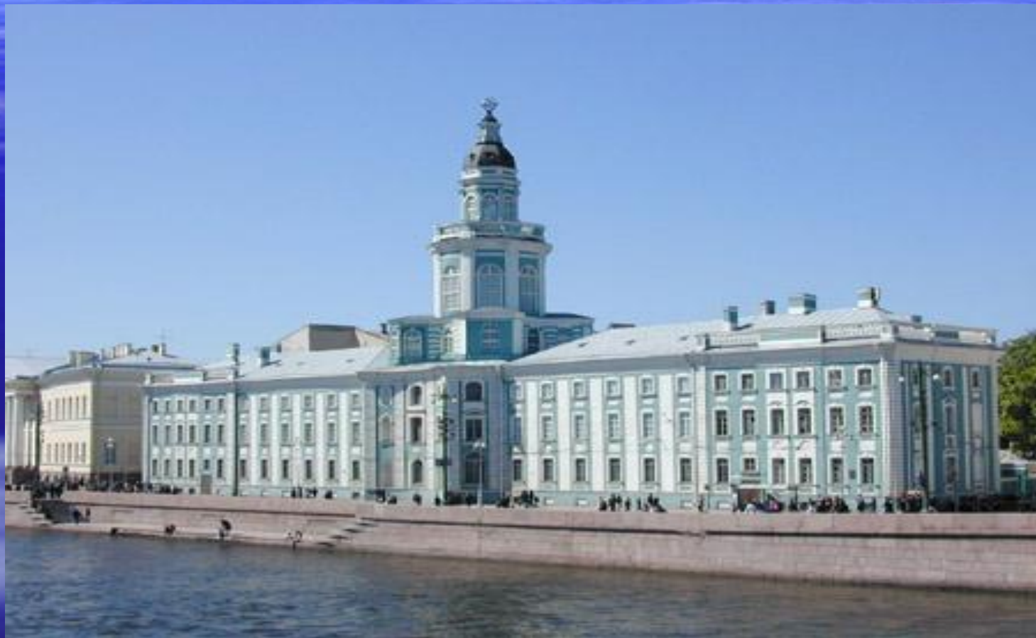
Кунсткамера, арх. Маттарнови, Киавери