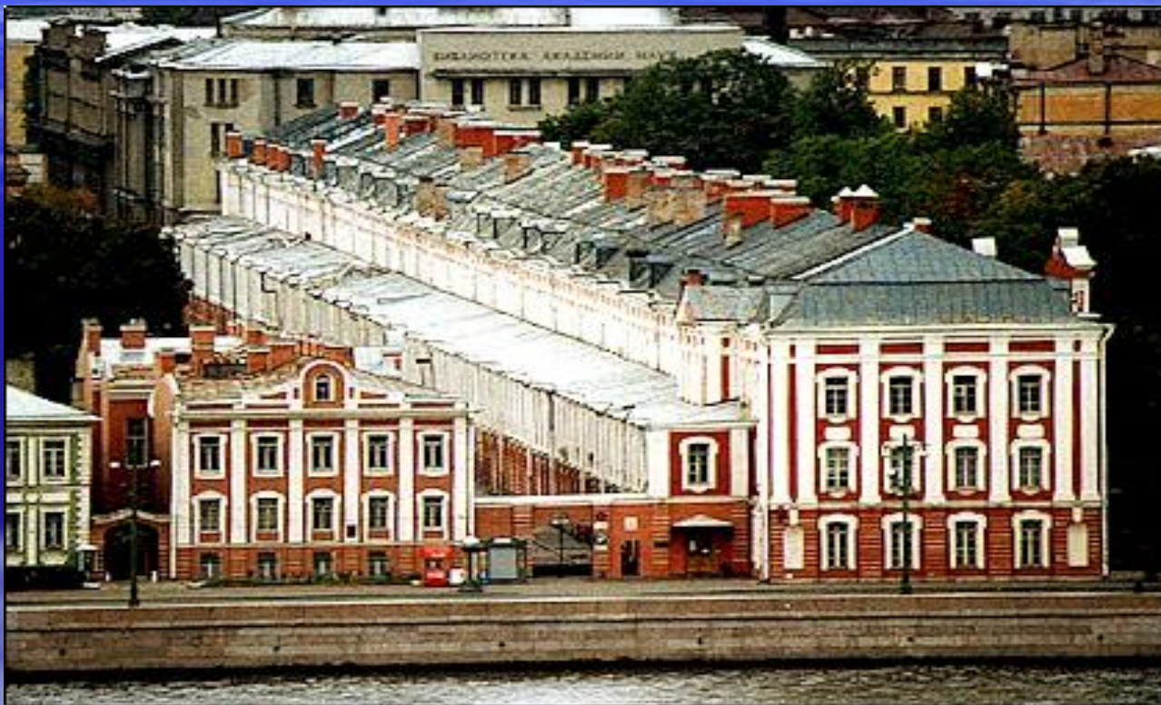
Здание двенадцати коллегий, арх. Трезини