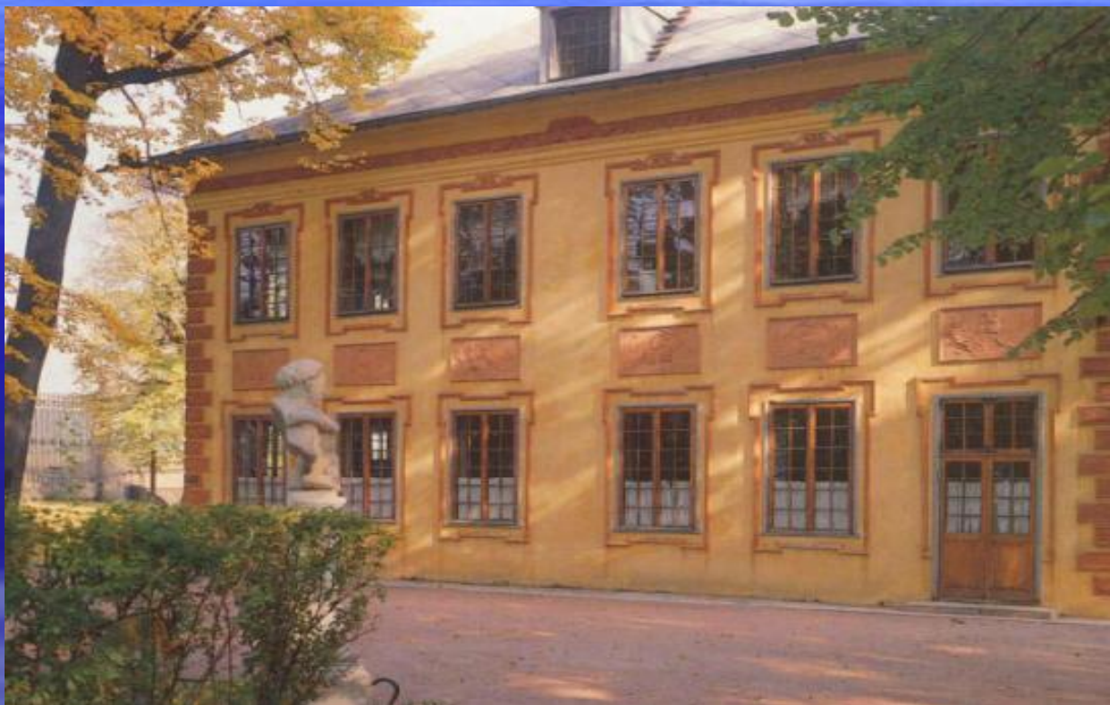
Летний дворец Петра Первого в Летнем саду, арх. Трезини