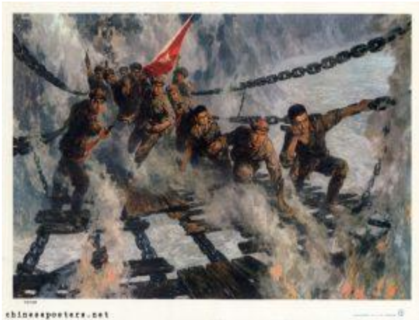
Стремительное пересечение моста Лудин