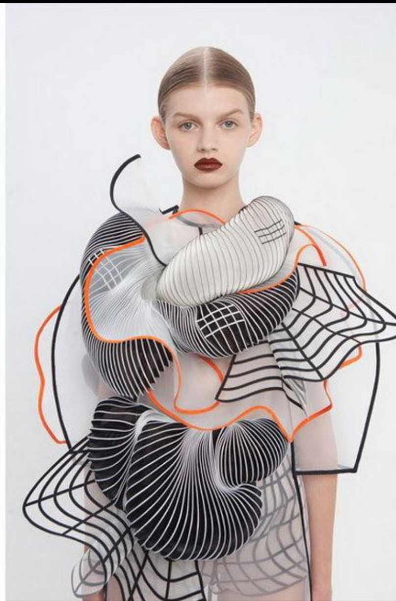
Бионический метод проектирования