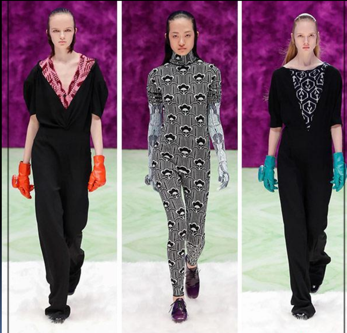
Комбинезоны в коллекции Prada FW 2021-2022