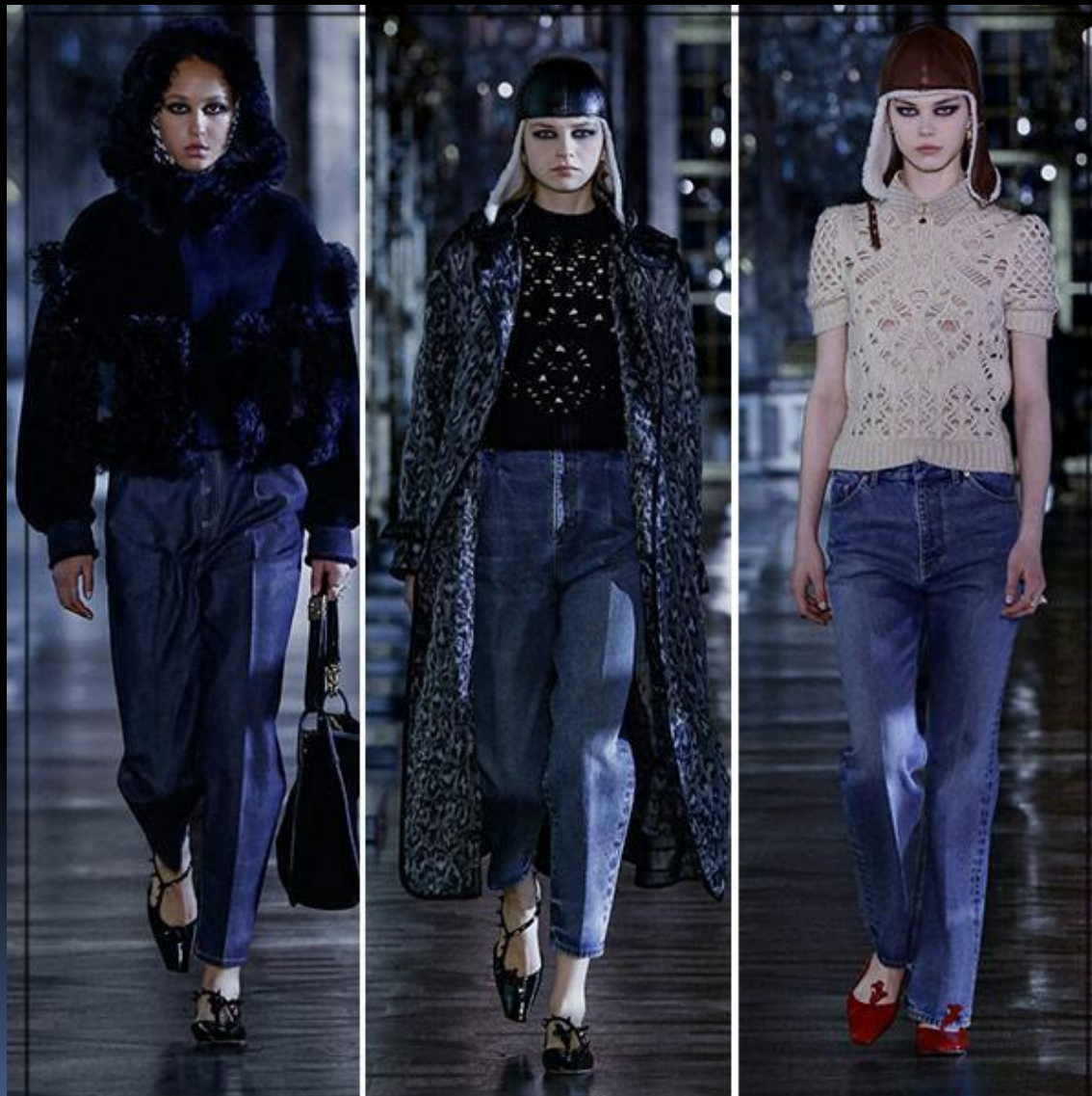
Прямые джинсы и джинсы с высокой посадкой от Christian Dior