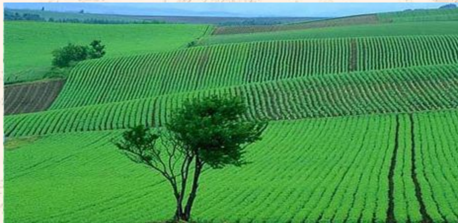
Пахут землю поперёк склонов оврага