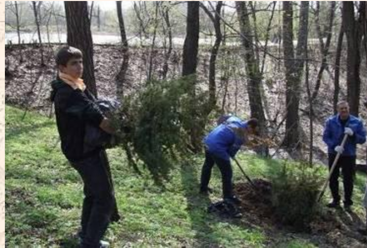
Сажают деревья и кустарники