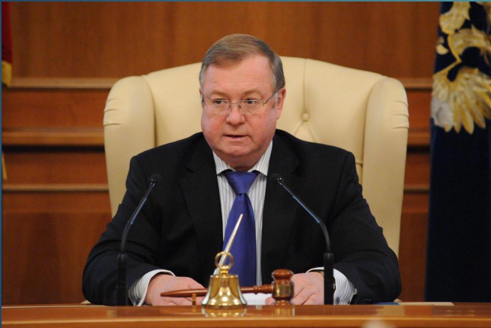
Степашин Сергей Вадимович

Председатель общественного совета: Степашин Сергей Вадимович, председатель наблюдательного совета государственной корпорации — Фонда содействия реформированию жилищно-коммунального хозяйства.