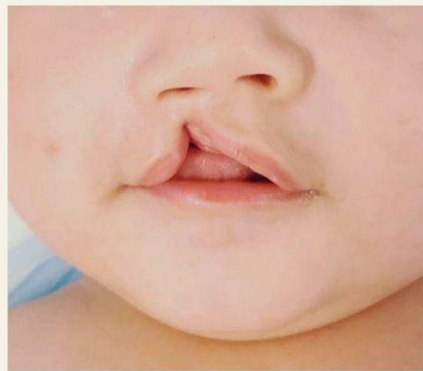
раздвоение губы и нёба