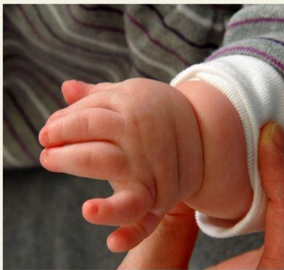
появление дополнительных пальцев