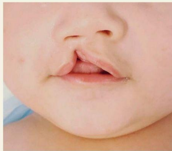
раздвоение губы и нёба