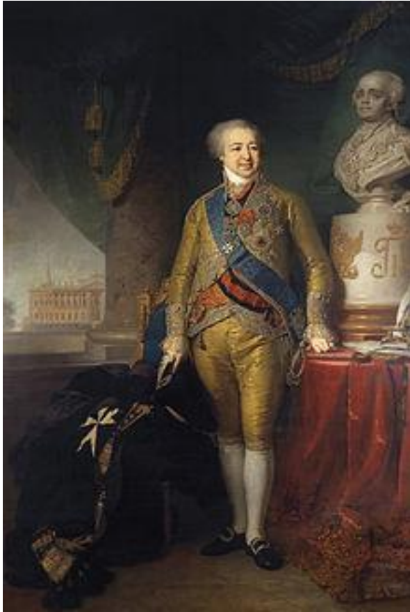
Александр Борисович Куракин