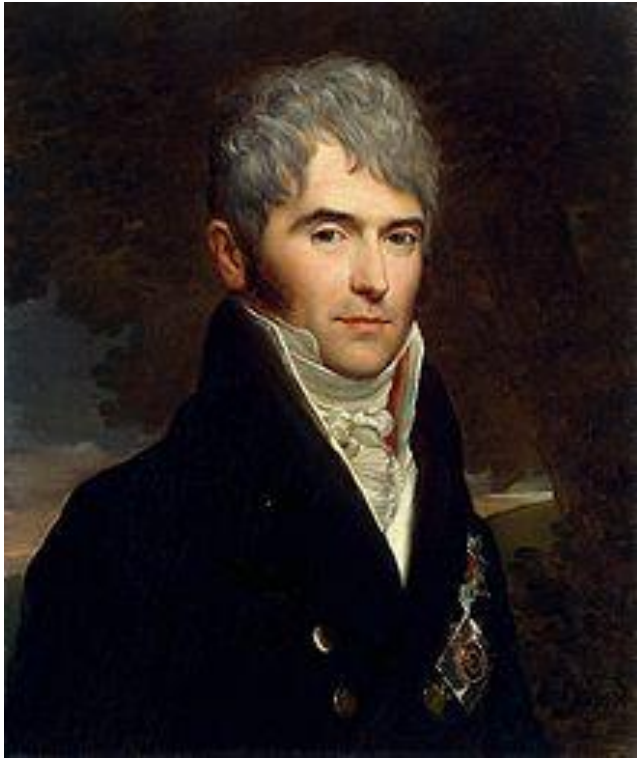
Виктор Павлович Кочубей