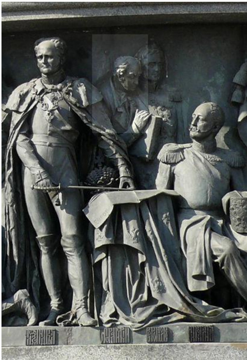
Фрагмент Памятника «Тысячелетие России» 1862 год Великий Новгород