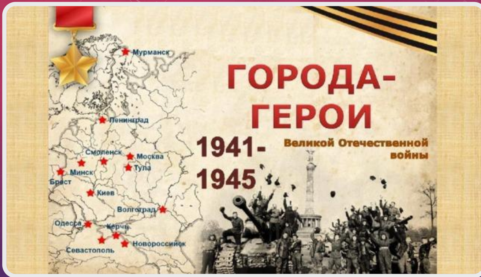
Карта городов-героев 1941-1945г. (12 городов-героев и 1 крепость-герой)