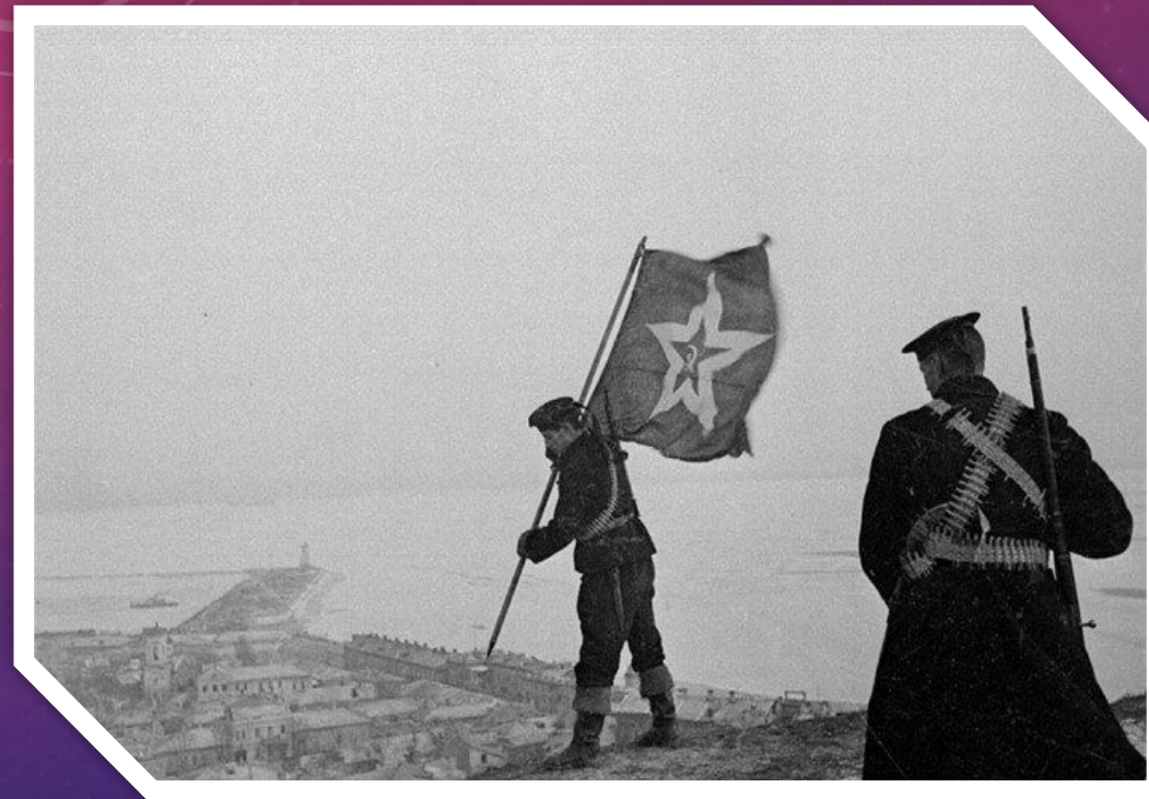
Советские морские пехотинцы устанавливают корабельный гюйс на самой высокой точке керчи – горе митридат. Апрель 1944 года.