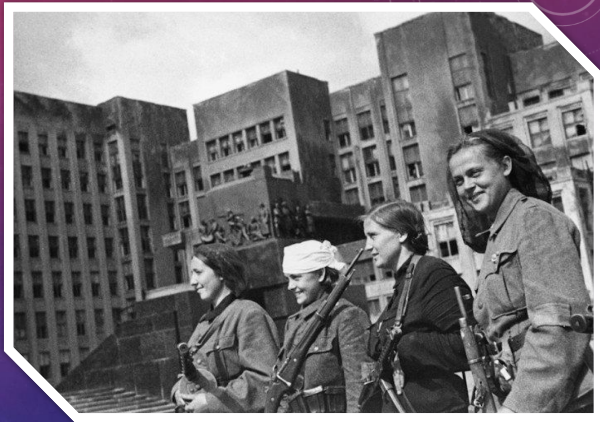
Белорусские партизаны на площади Ленина в Минске, после освобождения города от гитлеровских захватчиков. 1944 год.

Минск был освобожден советскими войсками 3 июля 1944 года. Теперь эта дата отмечается, как День Независимости Республики Беларусь. В 1974 году в ознаменование заслуг граждан города в борьбе против нацизма Минск получил звание Город — герой.