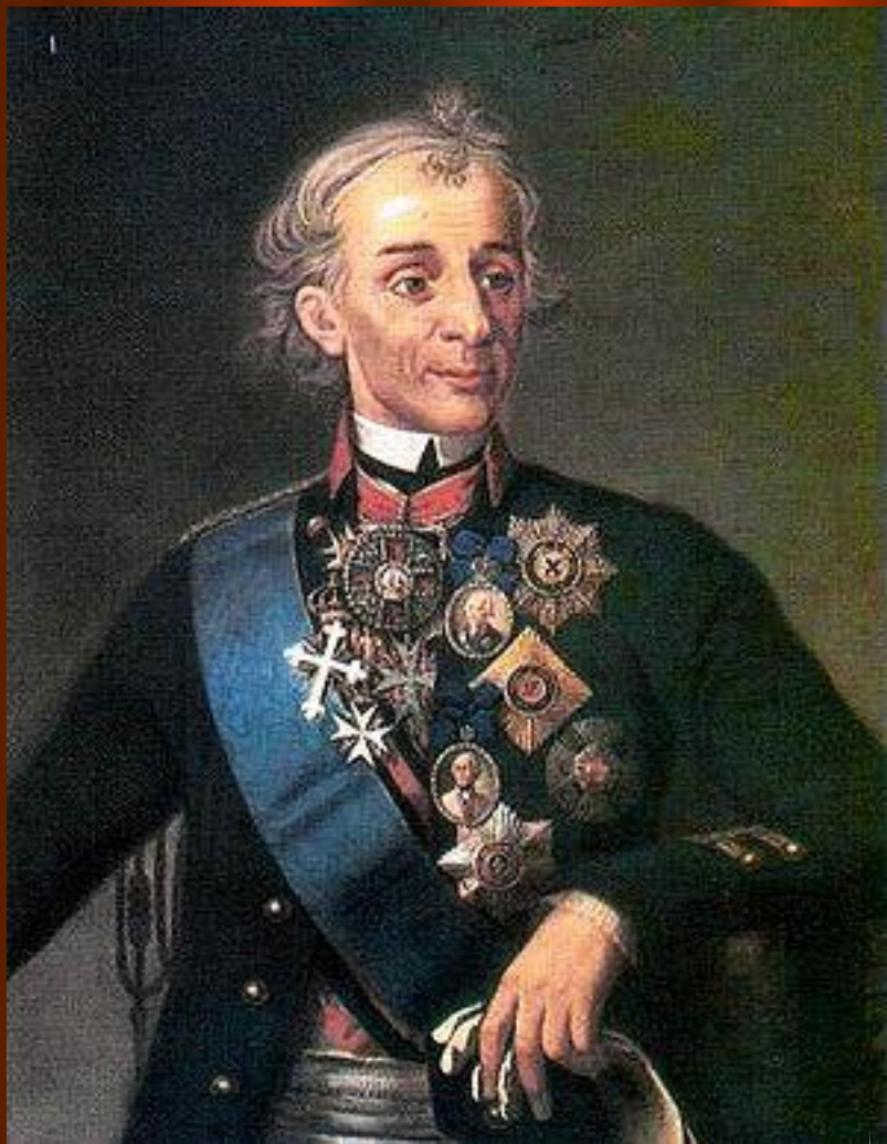
А. В. Суворов ( 1730 – 1800 )