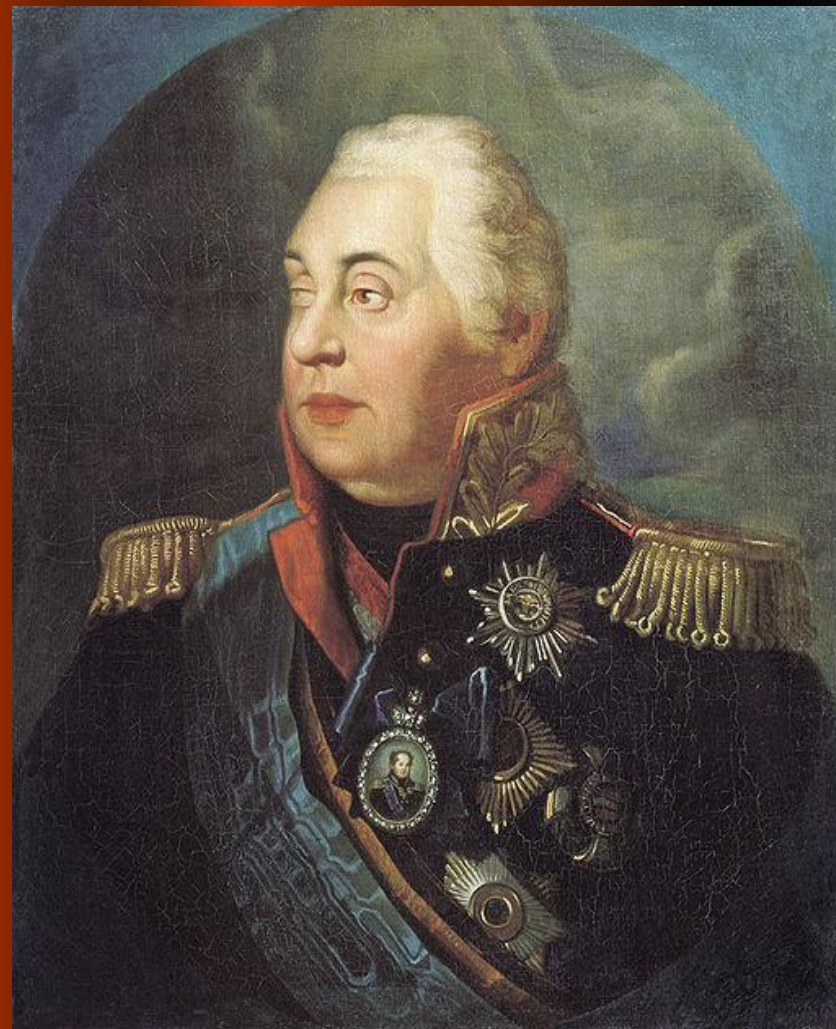
М. И. Кутузов ( 1745-1813 )