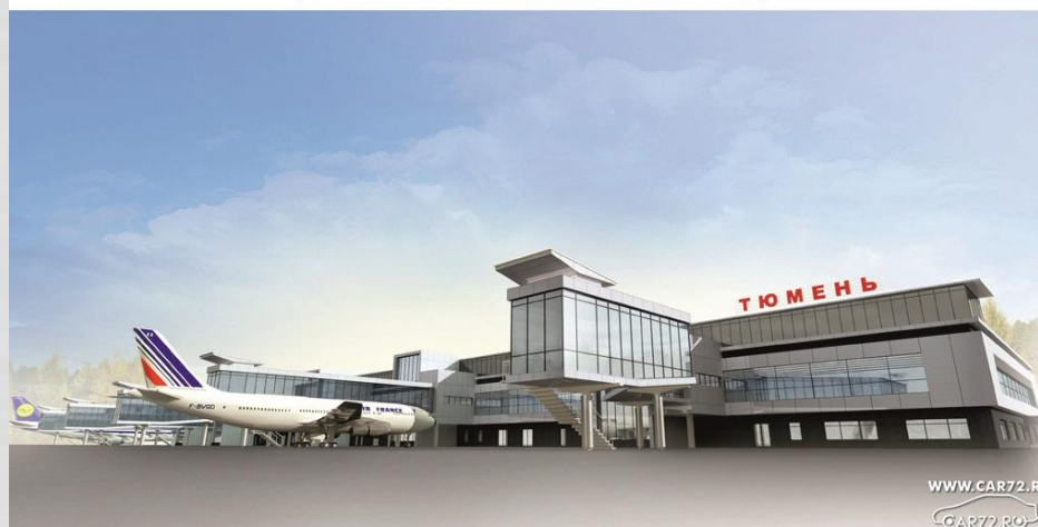
Перспектива фасада со стороны летного поля.