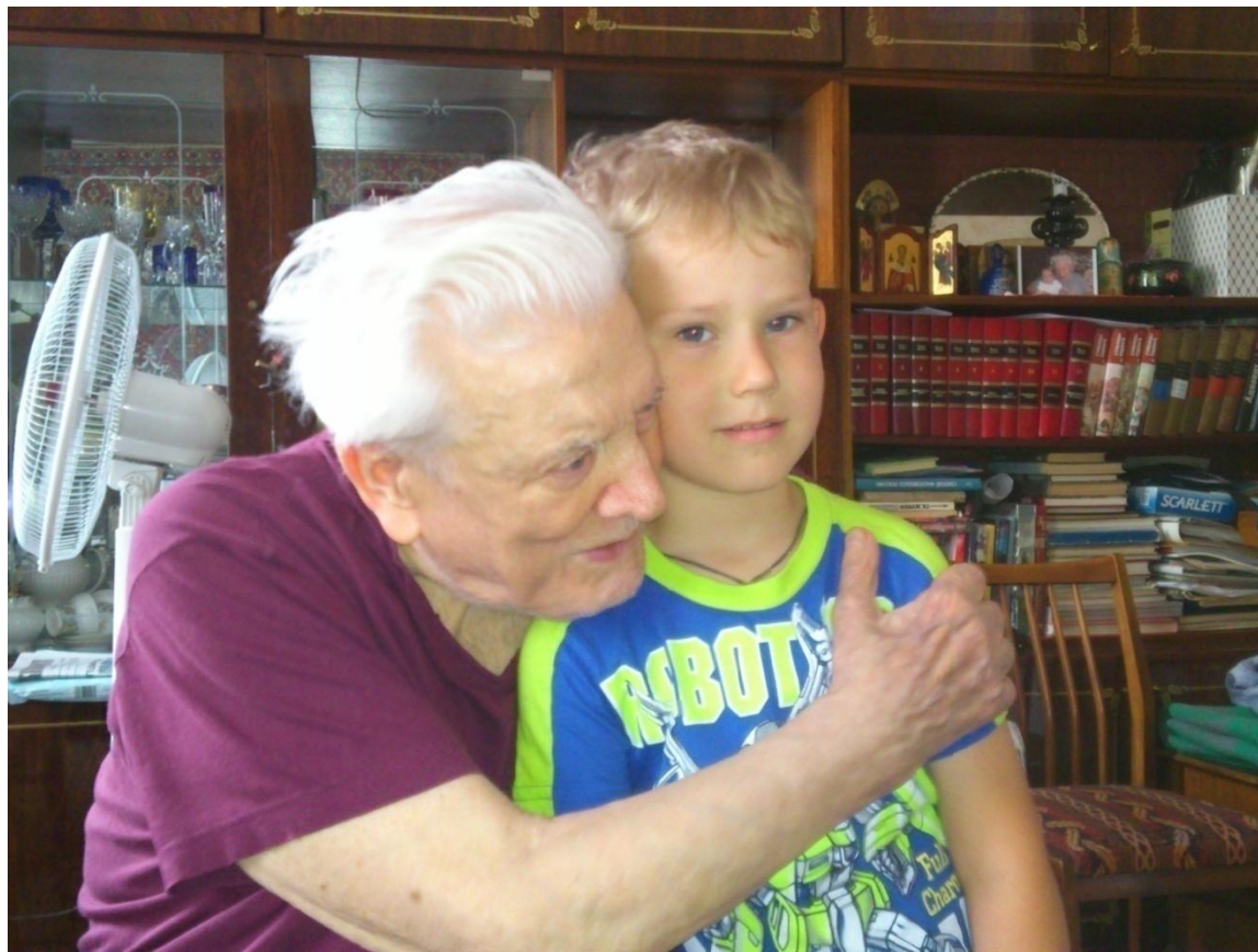
Я с прадедушкой - 2013год