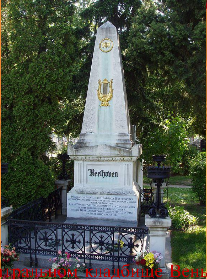
Могила Бетховена на центральном кладбище Вены в Австрии.