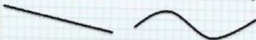
Прямая и ломанная линии