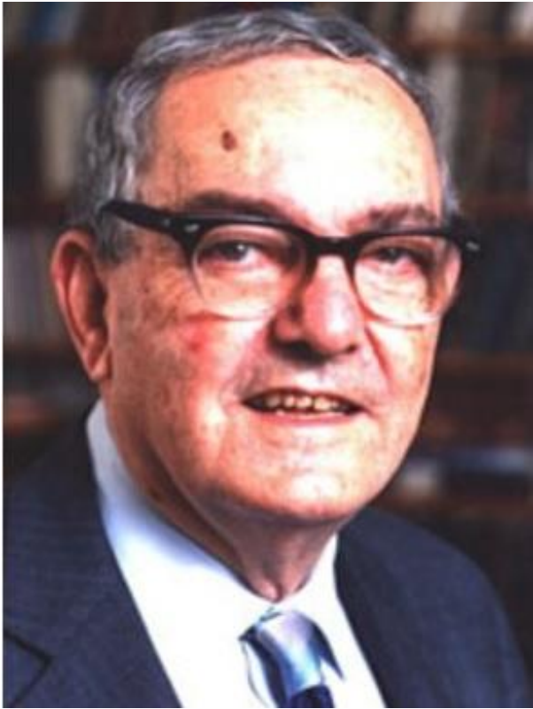
Г. Саймон (1916-2001)

Представители: Д. Марч, Г. Саймон и А. Этциони.