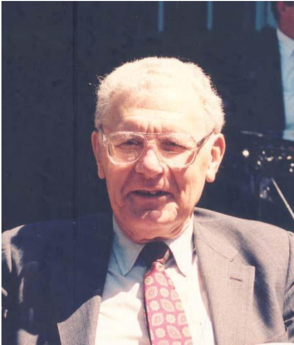
Р. Акофф (1919-2009)

Представители: Р. Акофф, Л. Берталанфи, С. Бир, А. Гольдбергер, Д. Фосрестер, Р. Люс, Л. Клейн, Н. Джорджеску-Реган