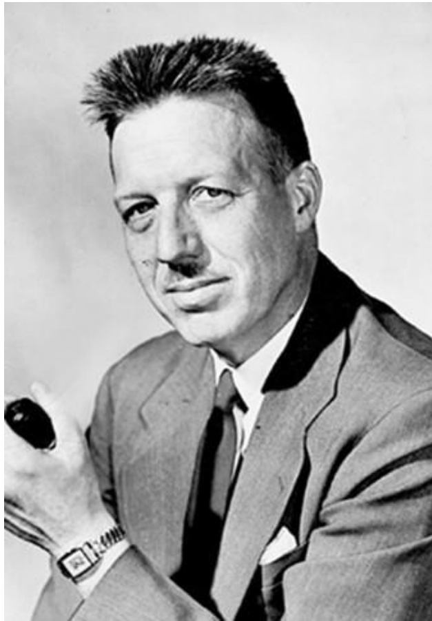
Д. Мак-Грегор (1906-1964)

Представители: Р. Лайкерт, К. Арджирис, Ф. Герцберг, Д. Мак-Грегор