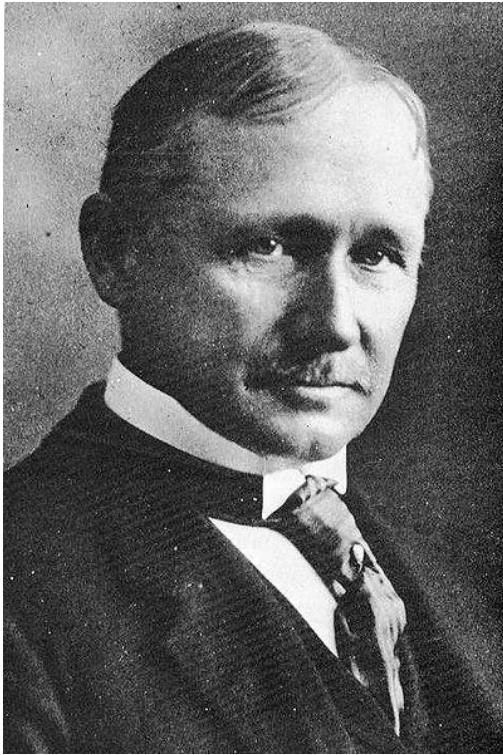
Фредерик Уинслоу Тэйлор (1856 – 1915 гг.)

Основоположник: Фредерик Уинслоу Тэйлор (1856 – 1915 гг.)