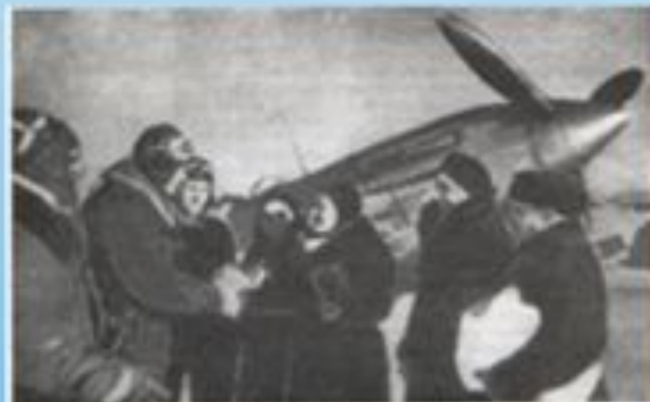
Полк ночных истребителей имени Алексея Николаевича Севастьянова. Москва, 1942 г.

Все горожане действительно знали фамилию летчика-героя Севастьянова. Свой подвиг он совершил на глазах у тысячи ленинградцев. Ему писали письма, приглашали на заводы. А когда ленинградские хлебопеки привезли в полк ночных истребителей черно-серый блокадный «выборгский крендель» как символ дружбы ленинградцев и фронтовиков, первый кусок этого кренделя отрезали Алексею.