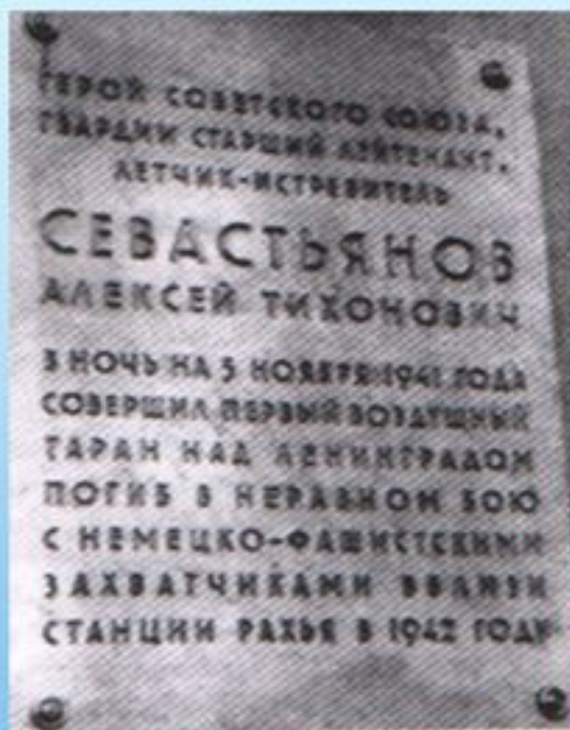
Чесменское кладбище. Место захоронения