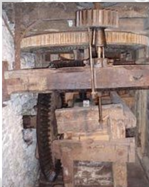
доставка на поверхность железной руды