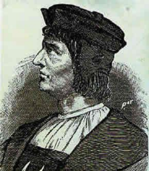
Диего Кан (1460-1482)