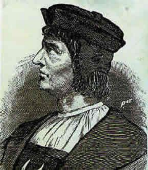
Диего Кан (1460-1482)