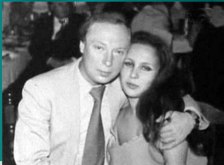
Валерий Ободзинский и Лолита Кравцова

После рождения дочерей Валерий твердо пообещал своей жене никогда не пить, и эта перемена в жизни сказалась на Валерии лучшим образом. Он решил всерьез заняться своей артистической карьерой, устроился в музыкальный ансамбль контрабасистом, но постепенно стал выступать и как солист.