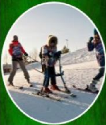
Чемпионат по спортивному ориентированию, соревнования «Лыжи для всех» им. Г. Куклевой