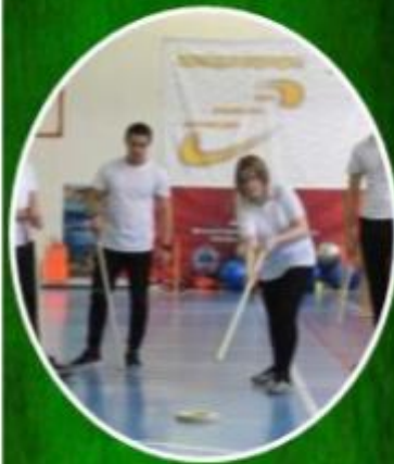
Региональный чемпионат «Abilympics- 2017» по компетенции «Адаптивная физическая культура и спорт»