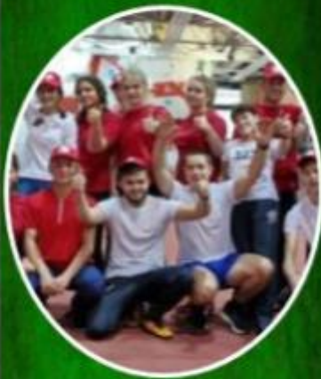
Открытый городской фестиваль ВФСК «Готов к труду и обороне» для инвалидов и людей с ограниченными возможностями здоровья