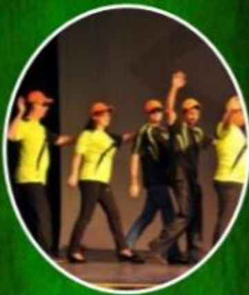
Общероссийский фестиваль КВН для слепых