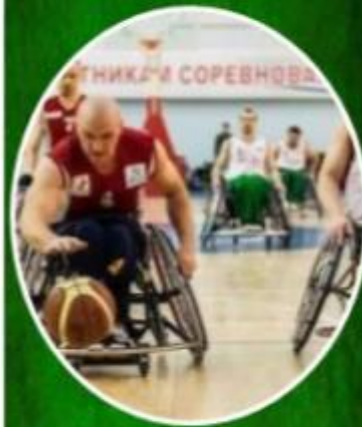
Чемпионат «Баскетбол на колясках»