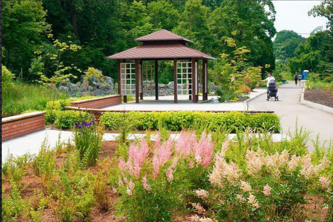
Ботанический сад во Владивостоке