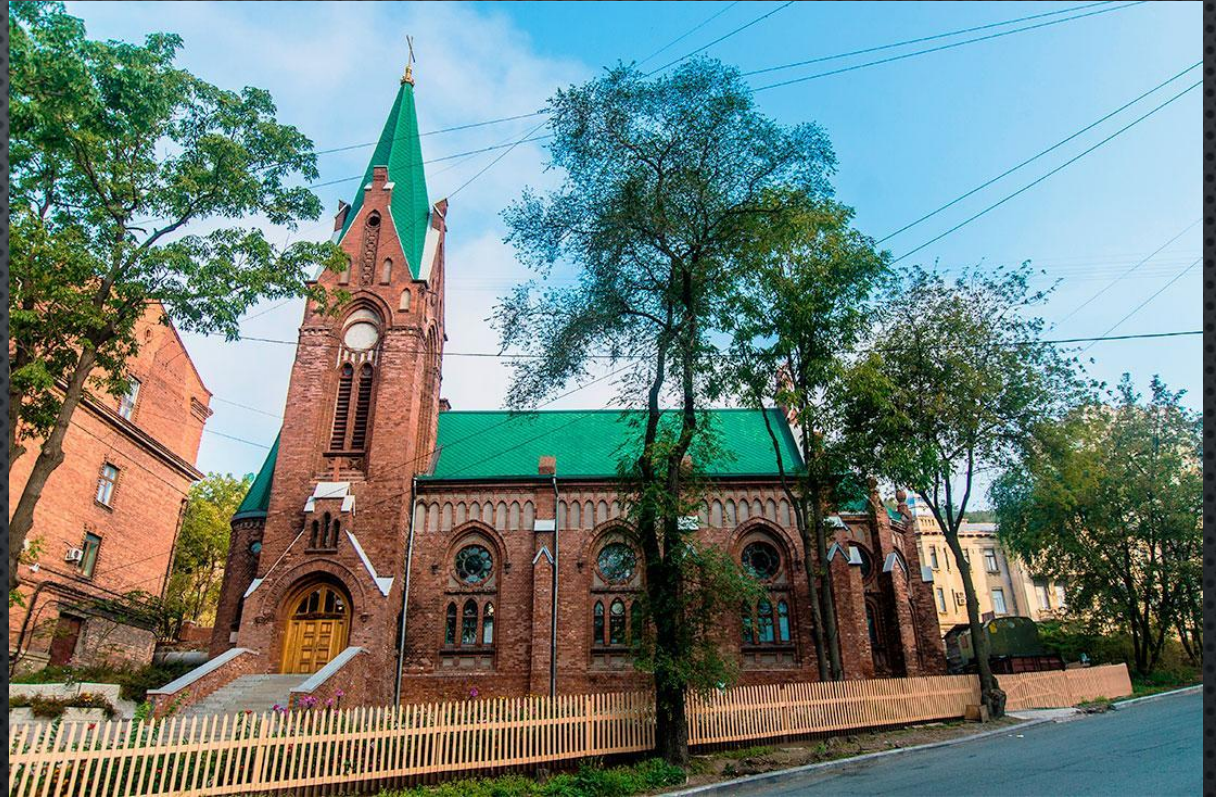
Лютеранская церковь Святого Павла.