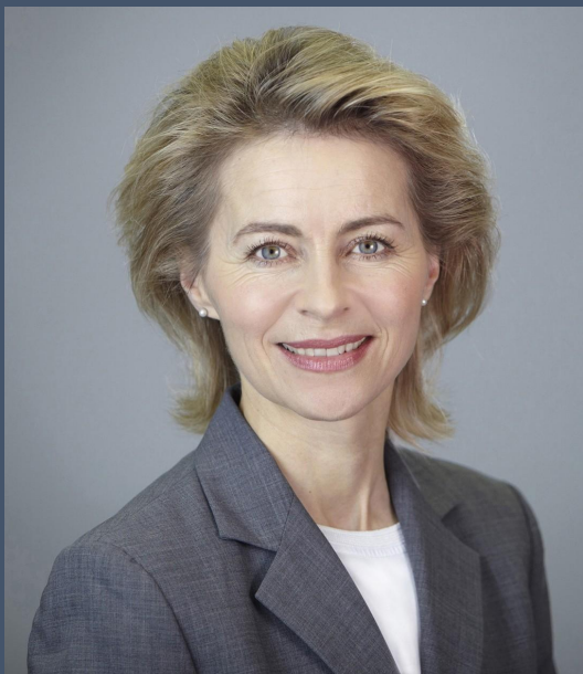
Урсула фон дер Ляйен Глава Еврокомиссии