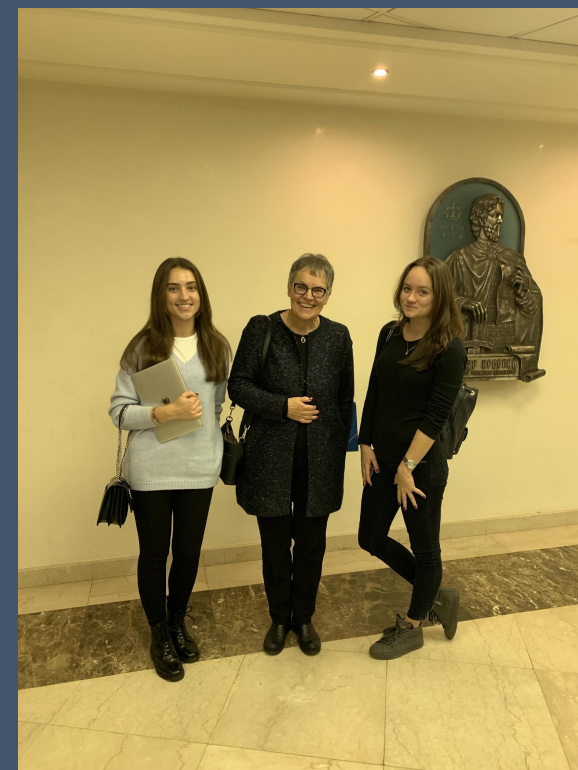
Глава ПАСЕ Лилиан Мори Паскье