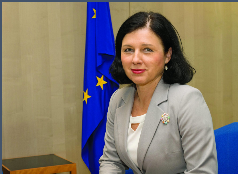
Вера Йоурова Заместитель председателя ЕК, ответственная за политику сохранения европейских ценностей и транспарентности