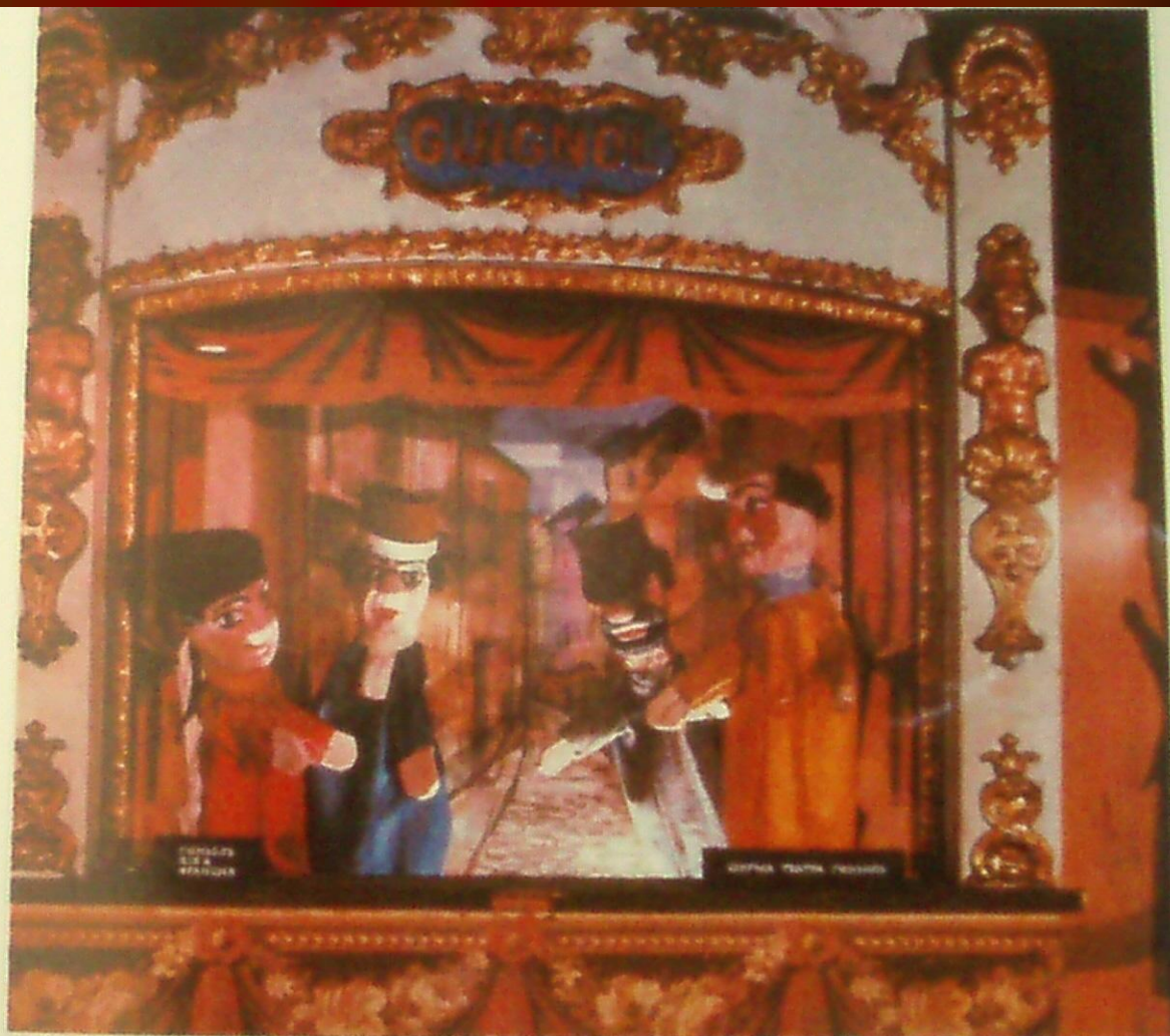
Ширма театра «Гиньоль» с народными кукольными персонажами.