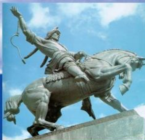
памятник Салавату Юлаеву