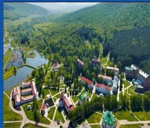
Красноусольские минеральные источники