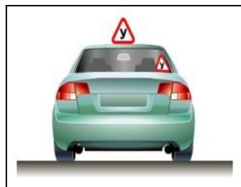
ИСПОЛЬЗУЕМЫЕ ДЛЯ УЧЕБНОЙ ЕЗДЫ