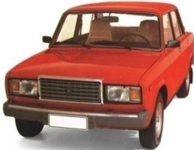
ТС отечественного производства