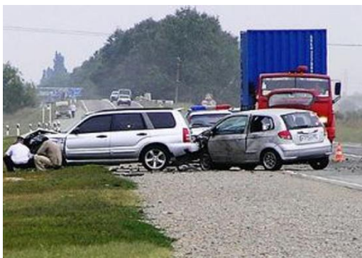
В процессе движения ТС