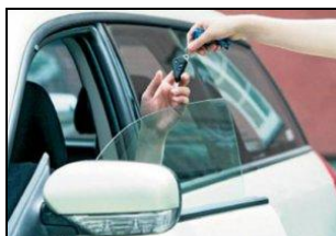
ПРОКАТНЫЕ ТС и ТС, СДАВАЕМЫЕ В АРЕНДУ