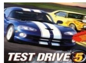
ИСПОЛЬЗУЕМЫЕ ДЛЯ ТЕСТ – ДРАЙВА