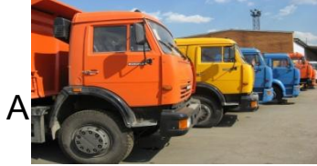
А ГРУЗОВЫЕ СЕДЕЛЬНЫЕ ТЯГАЧИ