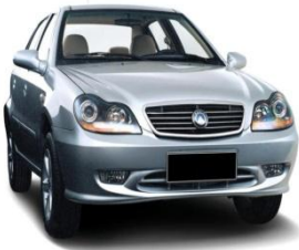
ТС иностранного производства