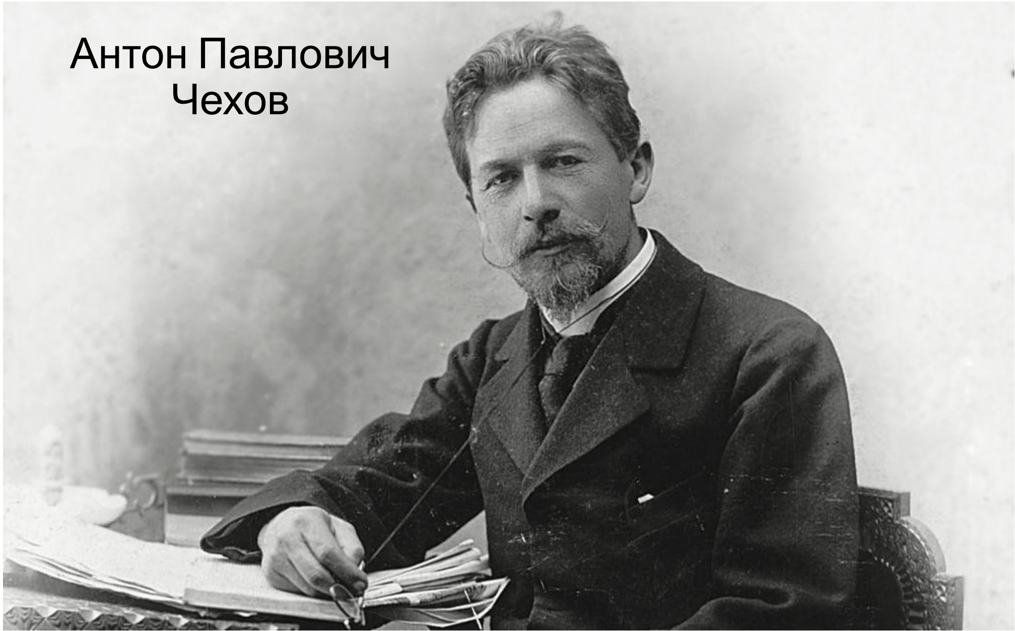
Антон Павлович Чехов