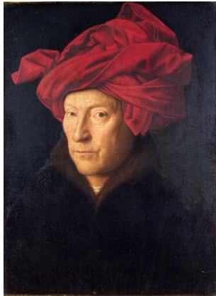
Ян Ван Эйк (1395 – 1441)