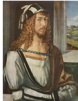
Альбрехт Дюрер (1471 – 1528)