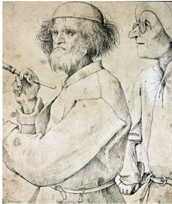
Питер Брейгель (? – 1569)