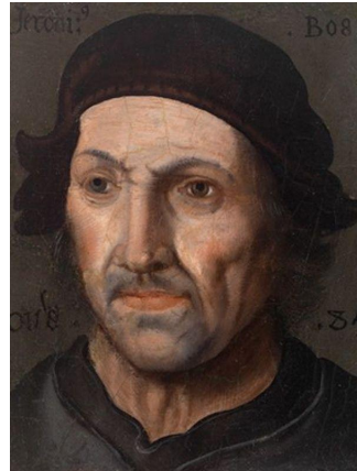
Иероним Босх (1450 – 1516)