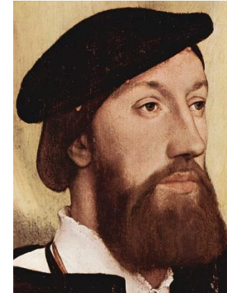
Ганс Гольбейн (1497 – 1543)