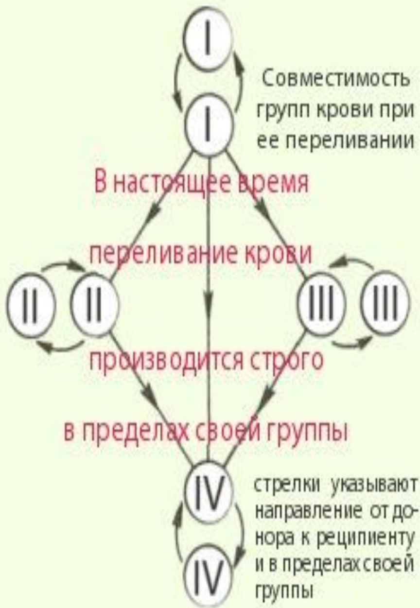
Схема переливания крови