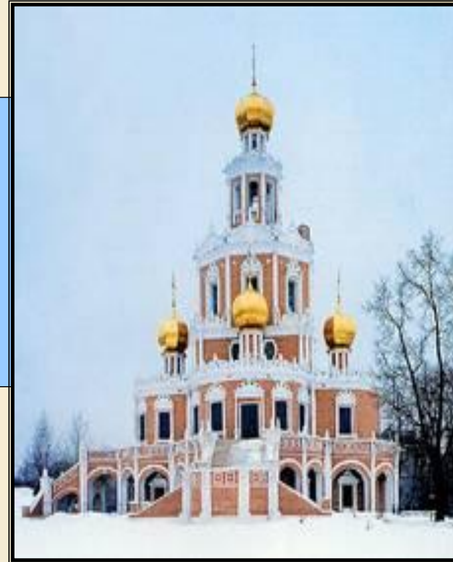
Церковь Покрова в Филях (1690-1695)

Нарядность, элегантность декора, строгая симметричность