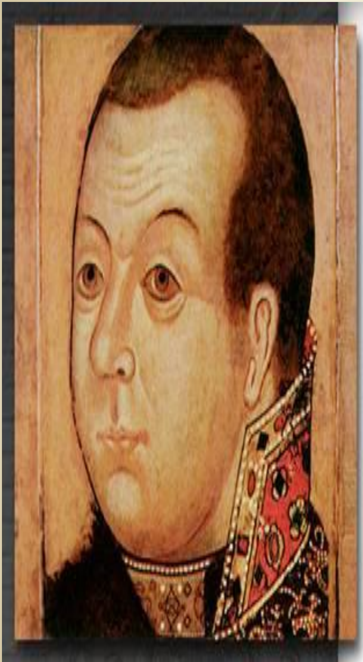
Князь М.В. Скопин-Шуйский. Парсуна

Парсуны (портреты, написанные в иконописной манере и иконной технике – на доске яичными красками)