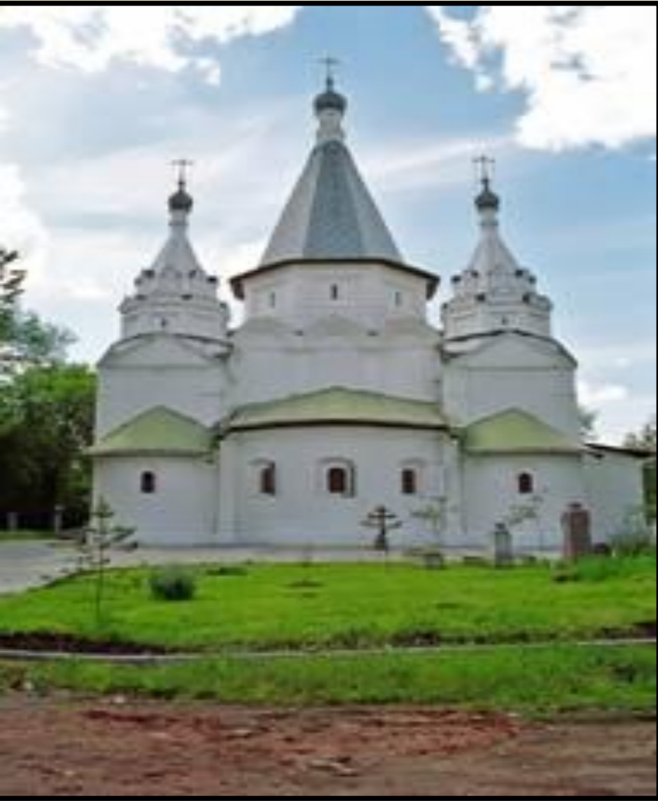
Церковь Троицы Живоначальной в Троицком-Голенищеве (1644-1645)

Патриарх Никон запретил строительство шатровых храмов