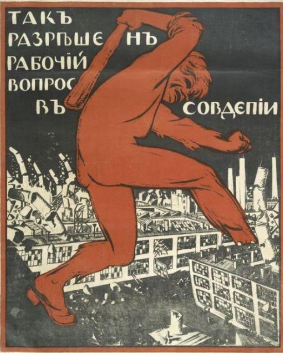
Гарсоні, Олівієні, Остун, Тортіно/Андрі