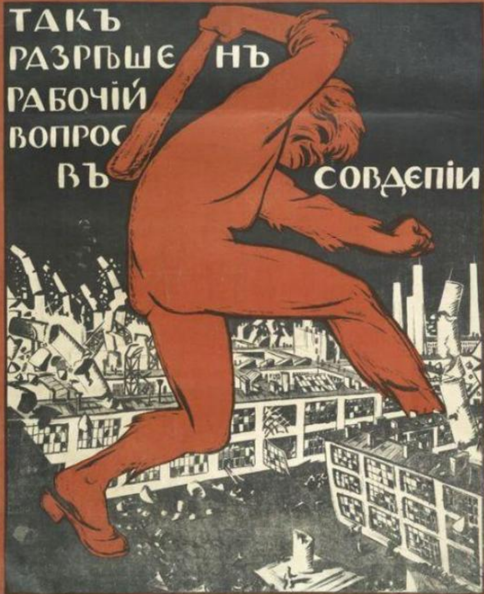
Гарсоні Олівієрі Остун Тортанолі

ТАКЪ РАЗРЪШЕ НЪ РАБОЧИЙ ВОПРОС ВЪ СОВДЪПИИ