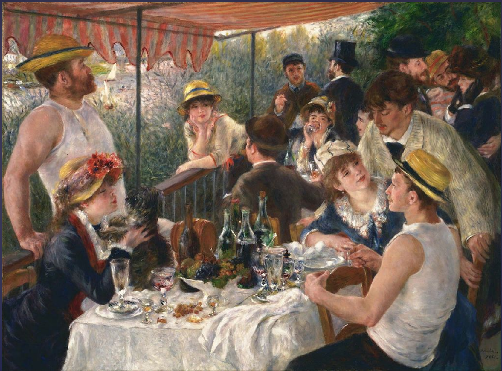
Завтрак гребцов. 1880—1881