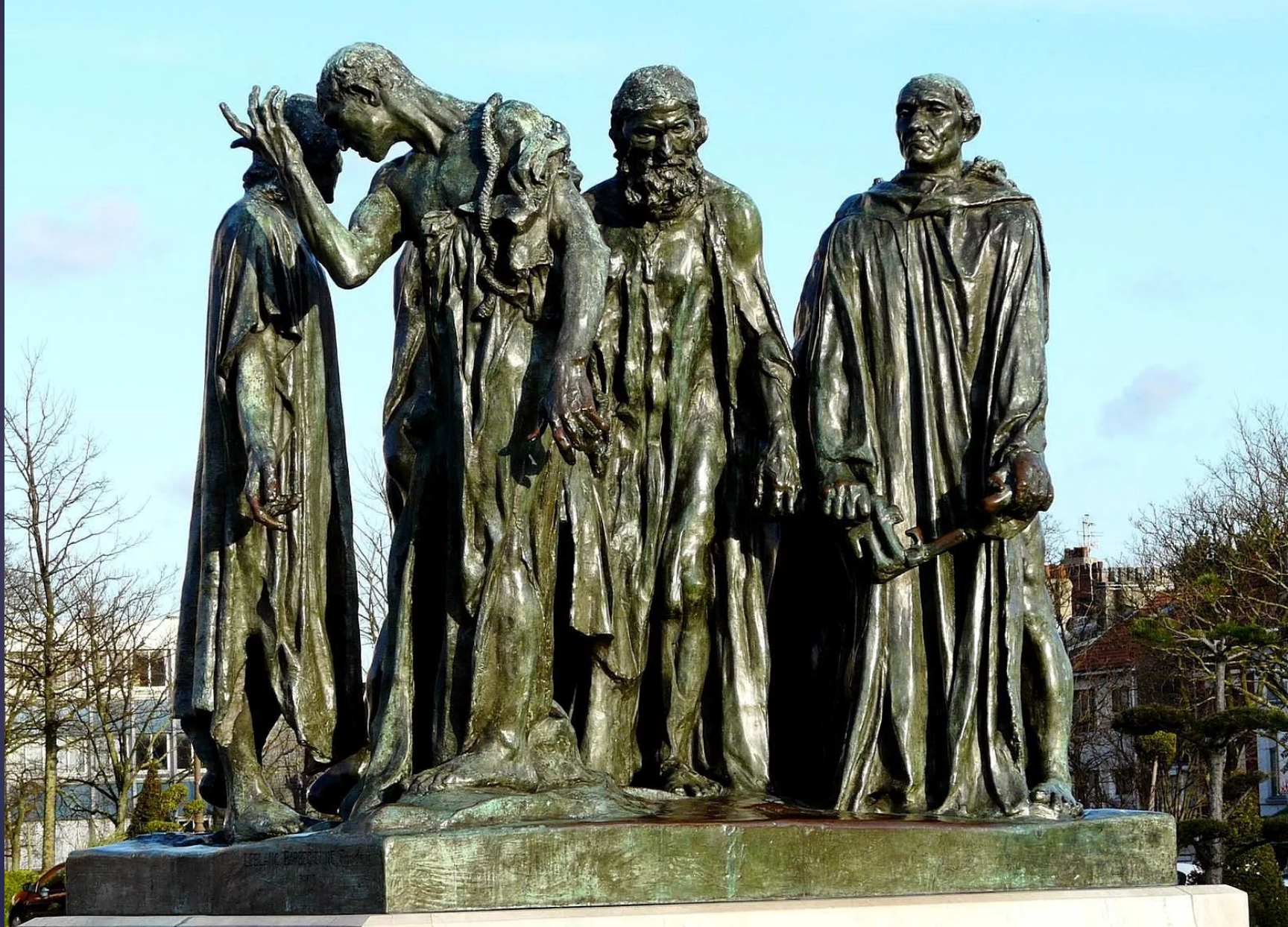
Граждане Кале. 1884—1888