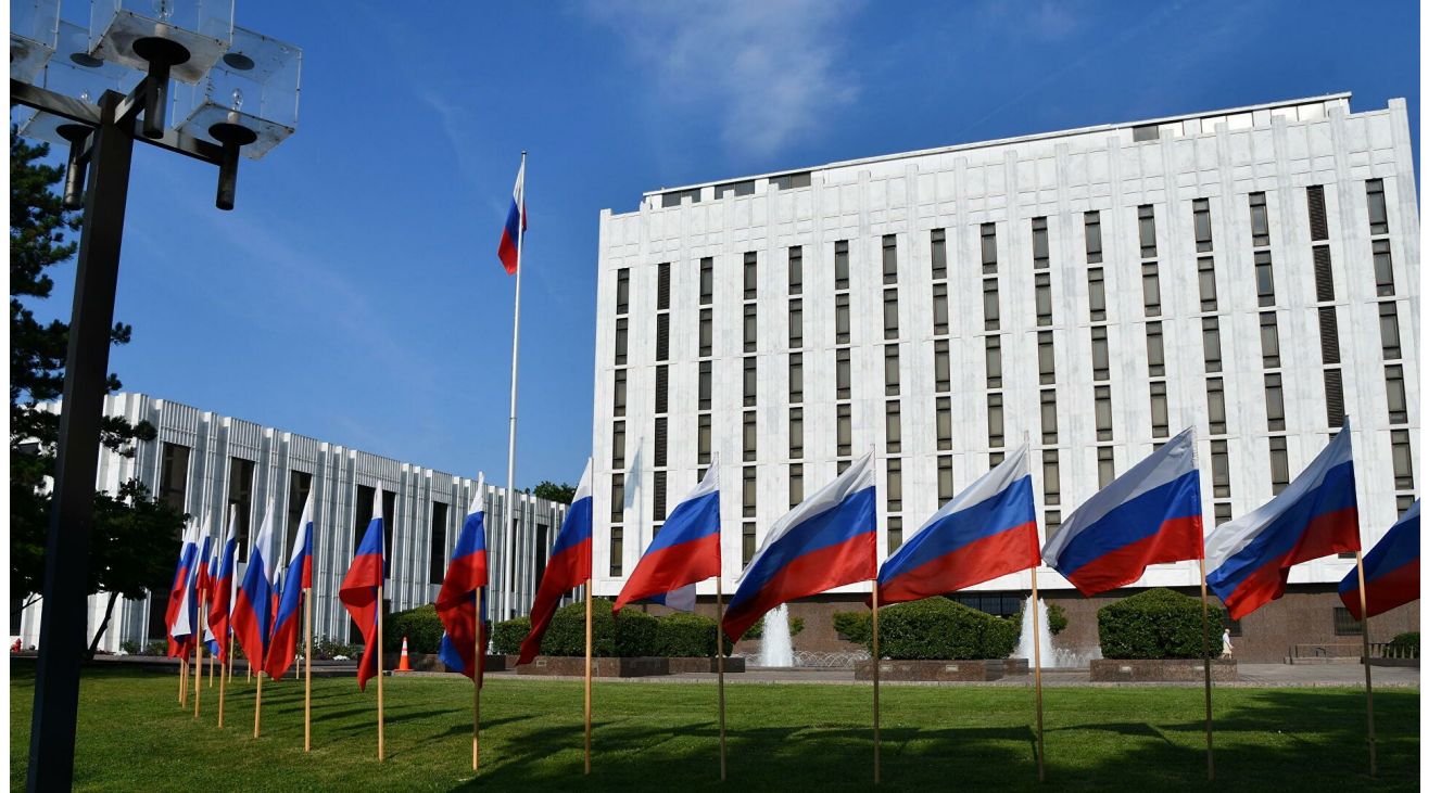
Консульство РФ в Вашингтоне, США