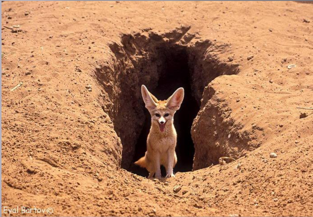
Eydl Bartov ©